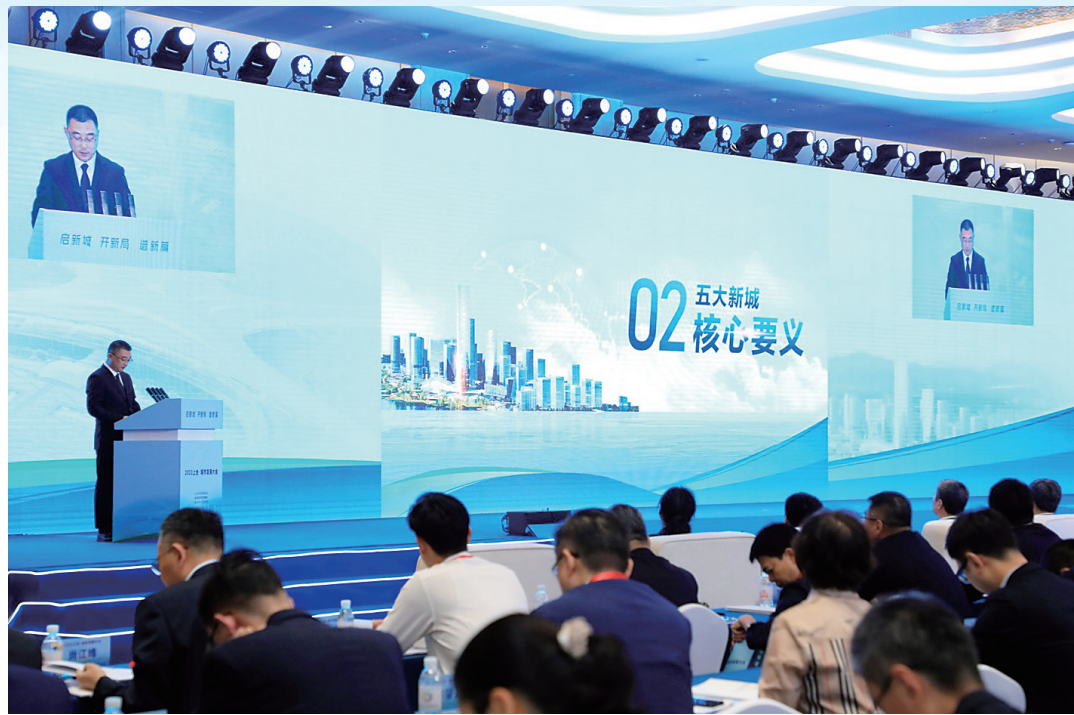
■2023上合·城市发展大会上，上合示范区“五大新城”新架构正式发布。