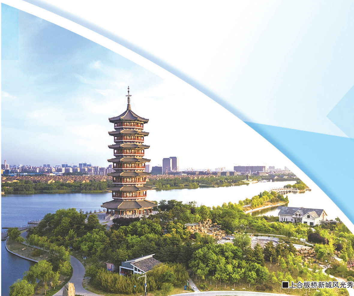
■上合板桥新城风光秀麗。