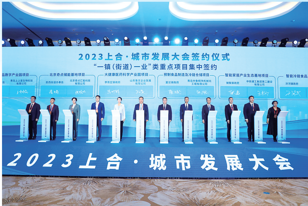
■“一镇(街道)一业”类重点项目集中签约仪式。

凡益之道，与时偕行。 乘“一带一路”东风，上合示范区将立足国家级开放合作平台战略优势，更加主动融入和服务国家重大战略，践行“1+2+3+N”发展格局，深化“5-2-1”