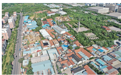
■青山路“插花地”整治提升前。