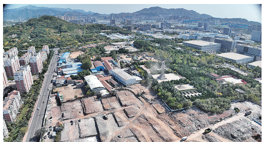
■青山路“插花地”违建已基本拆除。