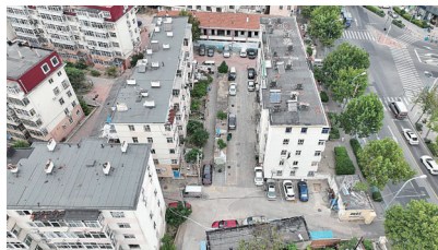
■内蒙古路30号老旧小区改造提升前。