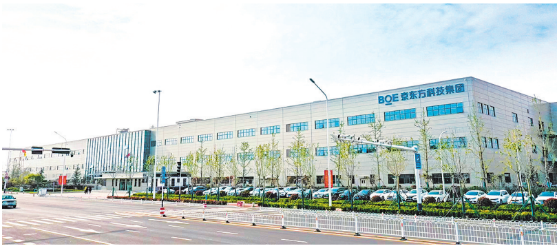
■京东方物联网移动显示端口器件生产基地。

岛开发区紧抓京东方全球最大移动显示模组单体工厂落地机遇，对标芯屏产业链“全景图”“现状图”，以打造“国内新型显示产业新增长极、国际显示技术创新策源地”为目标，锚定“做强模组、突破面板、拓展终端、技术攻关”四大主攻方向，制定实