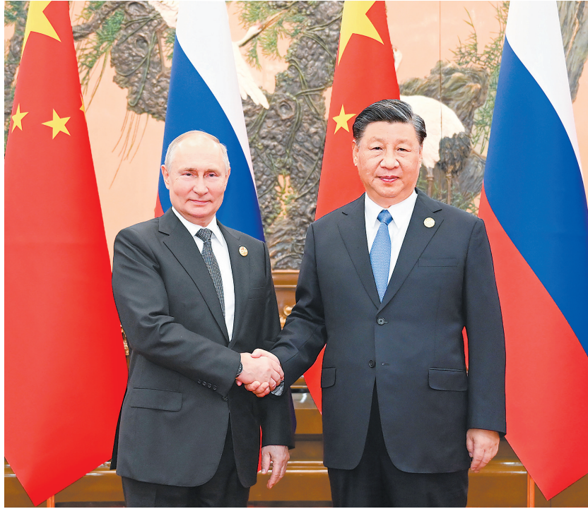
10月18日中午,国家主席习近平在北京人民大会堂同来华出席第三届“一带一路”国际合作高峰论坛的俄罗斯总统普京举行会谈。

习近平强调,发展永久睦邻友好、全面战略合作、互利合作共赢的中俄关系不是权宜之策,而是长久之计。明年是中俄建交75周年。中方愿同俄方一道,准确把握历史大势,立足两国人民根本利益,不断充实双方合作的时代内涵。中方支持俄罗斯人民走自主选择民族复兴道路, (下转第四版)