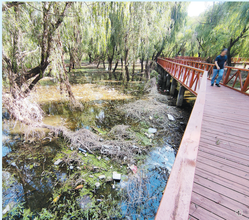
① 丹山湿地的水面上漂浮着大量垃圾。 ② 青岛北站网约车停车场垃圾遍地。 ③ 辽阳路快速路桥下绿化带被踩踏后黄土裸露。

近日,记者根据市民反映的有关情况,探访了丹山湿地、机场和青岛北站周边的网约车停车场以及辽阳路快速路桥下等地点,发现这些区域存在环境脏乱、绿植被破坏等问题,亟待相关部门采取措施,建立常态化管理机制,维护好城市品质。