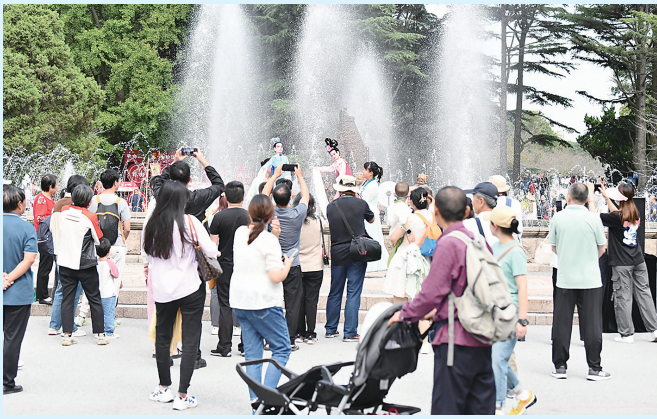
■“双节”假期期间，太平山中央公园中山公园园区的非遗展演吸引了市民游客的驻足。