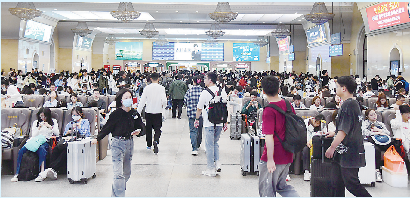
■“双节”假期期间，青岛站人流如织。

高铁、大巴、飞机、自驾，这个假期，总有一款出游方式适合你。记者从市交通运输局了解