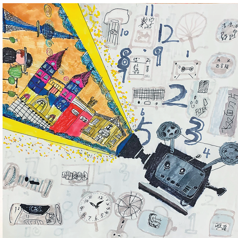
国晋铭 定陶路小学