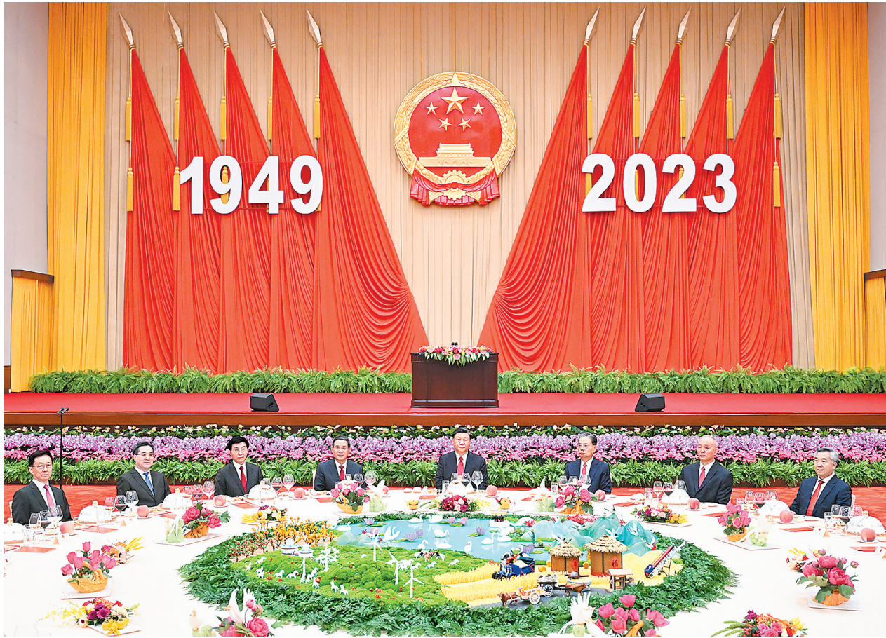
9月28日晚,庆祝中华人民共和国成立74周年招待会在北京人民大会堂举行。习近平、李强、赵乐际、王沪宁、蔡奇、丁薛祥、李希、韩正等党和国家领导人与中外人士欢聚一堂,共庆中华人民共和国华诞。