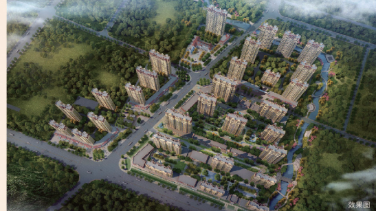
青南法字（青南）第027号