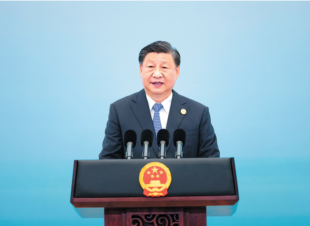
9月23日中午，国家主席习近平和夫人彭丽媛在浙江省杭州市西子宾馆举行宴会，欢迎来华出席杭州第19届亚洲运动会开幕式的国际贵宾。这是习近平发表致辞。