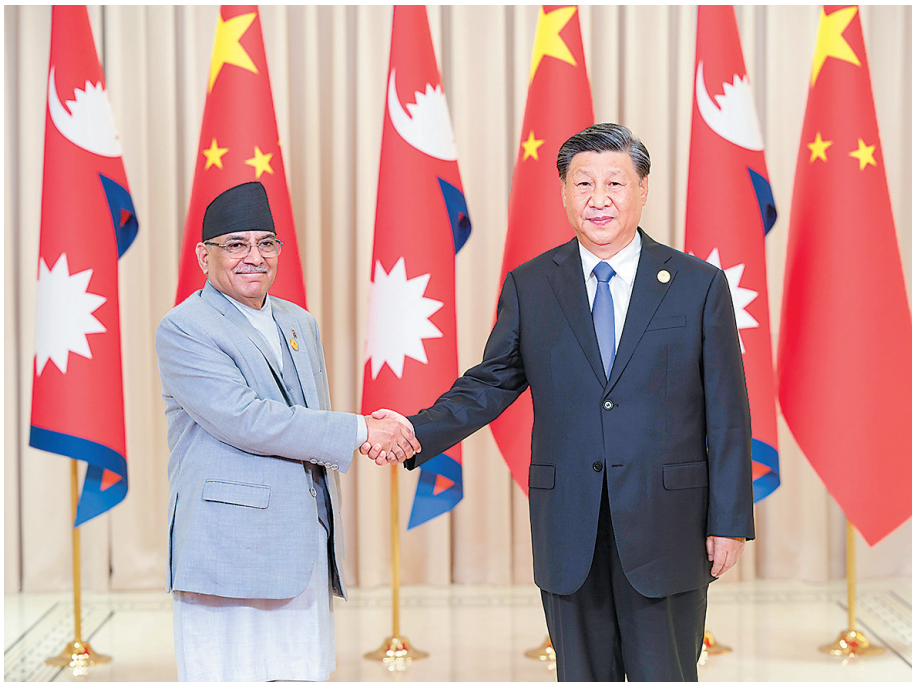
9月23日下午，国家主席习近平在杭州西湖国宾馆会见来华出席第19届亚洲运动会开幕式并进行正式访问的尼泊尔总理普拉昌达。