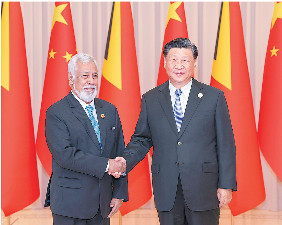
9月23日上午，国家主席习近平在杭州西湖国宾馆会见来华出席第19届亚洲运动会开幕式的东帝汶总理夏纳纳。