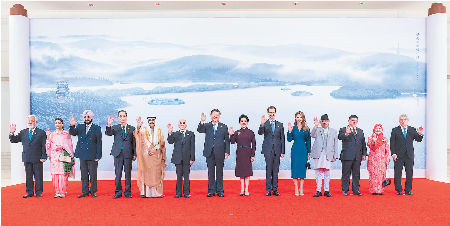
9月23日中午，国家主席习近平和夫人彭丽媛在浙江省杭州市西子宾馆举行宴会，欢迎来华出席杭州第19届亚洲运动会开幕式的国际贵宾。这是习近平和彭丽媛同贵宾们合影留念。

新华社杭州9月23日电(记者袁震宇 杨依军)9月23日中午，国家主席习近平和夫人彭丽媛在浙江省杭州市西子宾馆举行宴会，欢迎来华出席杭州第19届亚洲运动会开幕式的国际贵宾。 他们是：柬埔寨国王西哈莫尼、叙利亚总统巴沙尔和夫人阿斯玛、科威特王储米沙勒、尼泊尔总理普拉昌达、东帝汶总理夏纳纳、韩国总理韩德洙、马来西亚下议院议长佐哈里和夫人诺莱妮、亚奥理事会代理主席辛格和夫人维尼塔、国际奥委会主席巴赫，以及文莱苏丹代表苏弗里亲王、约旦亲王费萨尔、泰国