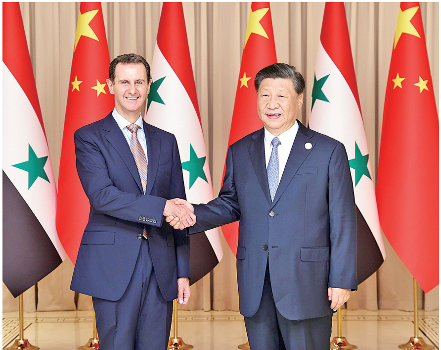
9月22日下午,国家主席习近平在杭州西湖国宾馆会见来华出席第19届亚洲运动会开幕式的叙利亚总统巴沙尔。

分别会见来华出席亚运会开幕式的叙利亚总统巴沙尔、科威特王储米沙勒、亚洲奥林匹克理事会代理主席辛格、国际奥林匹克委员会主席巴赫