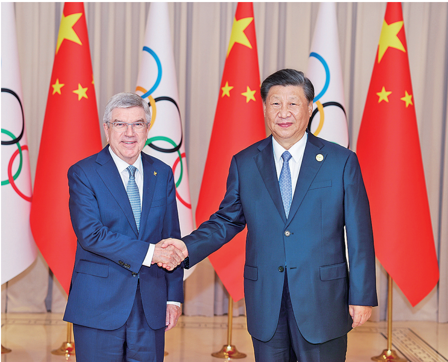
9月22日下午,国家主席习近平在杭州西湖国宾馆会见来华出席第19届亚洲运动会开幕式的国际奥林匹克委员会主席巴赫。 新华社照片

在第六个“中国农民丰收节”到来之际,中共中央总书记、国家主席、中央军委主席习近平代表党中央,向全国广大农民和工作在“三农”战线上的同志们致以节日祝贺和诚挚问候。 习近平指出,今年,我们克服黄淮罕见“烂场雨”、华北东北局地严重洪涝、西北局部干旱等灾害影响,全年粮食生产有望再获丰收,为推动经济持续回升向好、加快构建新发展格局、着力推动高质量发展提供了有力支撑。 习近平强调,各级党委和政府要深入贯彻党中央决策部署,锚定建设农业强国目标,稳住农业基本盘,扎实做好新时代新征程“三农”工作,全面推进乡村振兴,加快农业农村现代化步伐,坚持把增加农民收入作为“三农”工作的中心任务,千方百计拓宽农民增收致富渠道,让农民腰包越来越鼓、生活越来越好,绘就宜居宜业和美乡村新画卷!