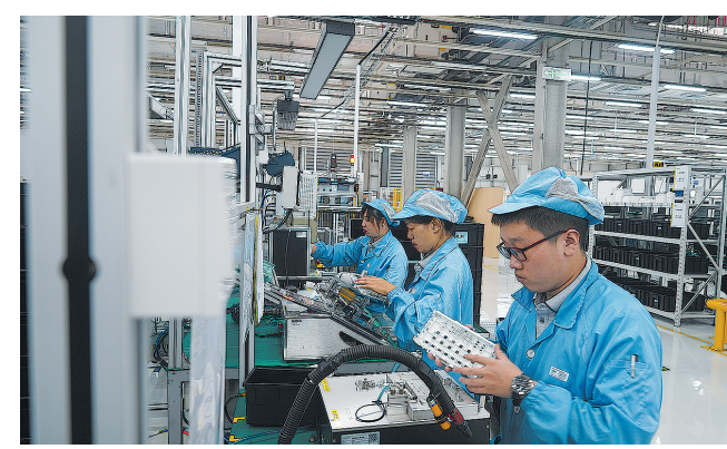
■德国代傲集团青岛工厂生产线。