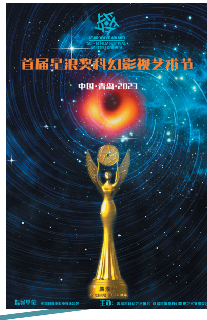
即将于十月份官宣的星浪奖是青岛首个科幻主题奖项。