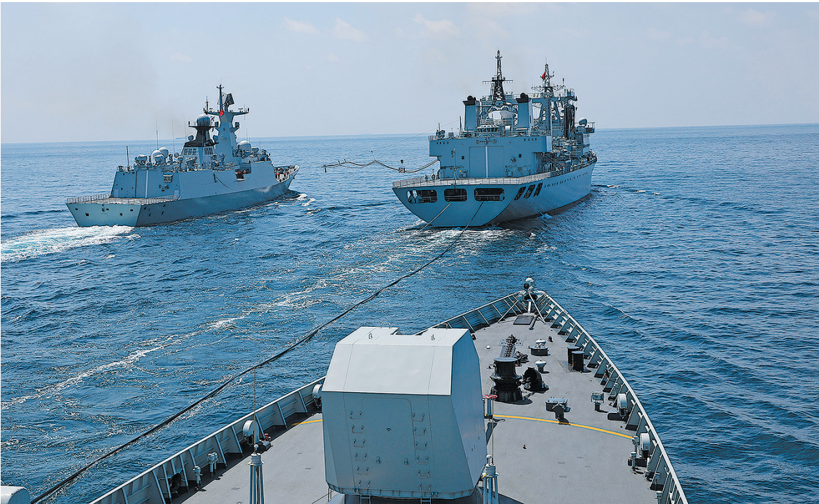
■中国海军第45批护航编队在任务准备期间组织航行补给训练。

任务准备期间,编队着眼护航新形势新要求,修订完善伴随护航、航行补给等方案预案,精心筹划部署、严密组织实施,重点开展了武力营救被劫持商船、反恐反海盗、实际使用武器等针对性训练,进一步提升了编队遂行任务能力。