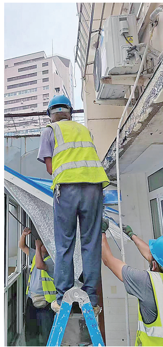
■施工人员在拆除违建。