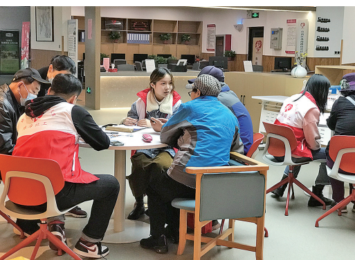
■市南区珠海路街道社工站开展智能手机课堂。

社会治理和民生保障渠道更加多元,捐赠形式更加多样,从捐赠财物为主向捐赠股权、知识产权等形式不断拓展。慈善动员能力不断增强,捐赠规模不断扩大,大额捐赠成为常态,参与方式更加便捷,互联网慈善蓬勃发展,成为慈善事业新的增长点,互联网募捐项目数量每年增长20%以上。