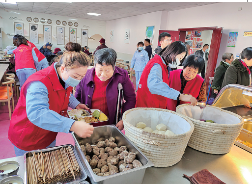
■即墨区社工在助老食堂开展为老服务。

扶危济困、雪中送炭。在青岛,“全民慈善”的慈善大格局已经形成,擦亮了大爱青岛的闪亮名片,汇聚了向上向善的强大力量。