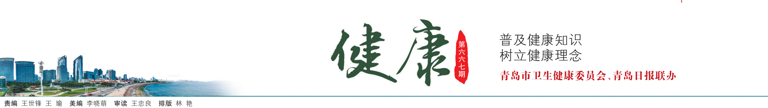
责编 王世锋 王 瑜 美编 李晓萌 审读 王忠良 排版 林 艳