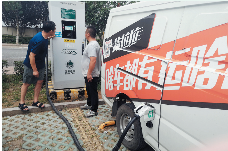
■ 在即墨区龙泉街道,一辆电动货车正在充电。

■ 诉求来源 市12345政务服务便民热线 观海新闻客户端“直通12345” 党报热线82863300 ■ 话题热度 ★★★★★