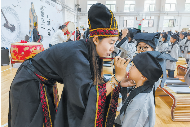
■市北区第二实验小学的老师为学生“朱砂启智”。

□青岛日报/观海新闻记者 王世锋 韩星 本报8月28日讯 28日是青岛中小学校正式开学的日子。在教育主管部门指导下，各学校纷纷组织开展了丰富多彩的开学仪式：邀请抗美援朝老兵讲述红色故事，赓续红色血脉；举办国风气息浓郁的开学典礼，传承中华优秀传统文化……一堂堂生动、鲜活的“开学第一课”引领学生们开启新学期的学习生活。