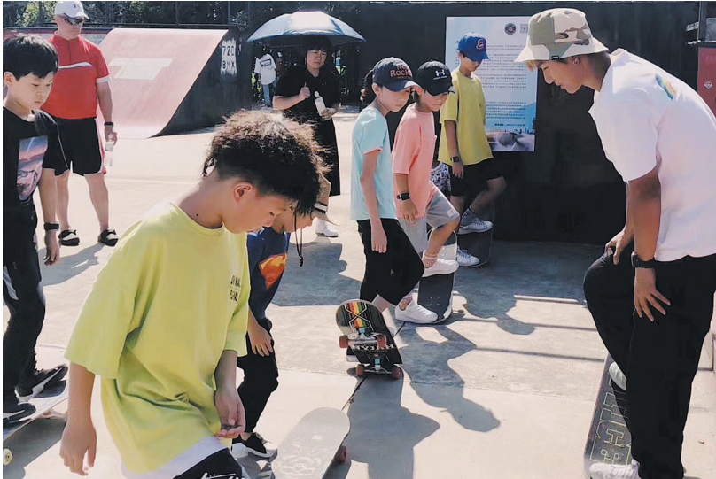
■“斜杠青年”大超创业做滑板教培的同时，经营着自己的运动博主账号。