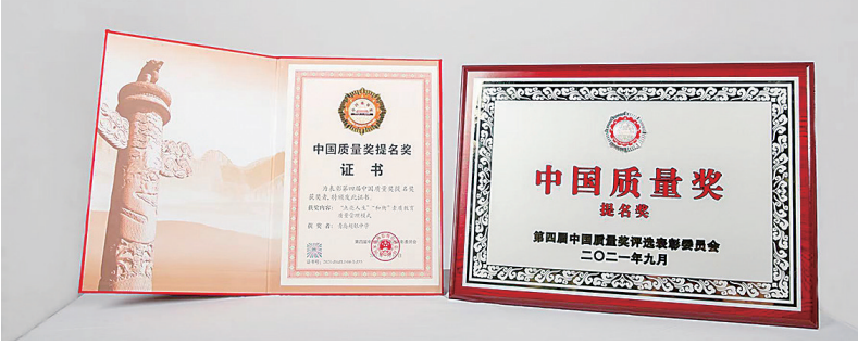
■超银中学获得第四届中国质量奖提名奖。

入学校发展的方方面面。如今，“点亮人生”“和衡”素质教育质量管理模式已成为超银办高质量教育的核心秘籍。