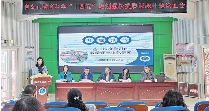
■崂山六中举行“十四五”规划强校提质课题开题论证会。

“问题解决式集体备课”培训就是具体行动之一。学校基于专家引领、名师带动，积极开展“问题解决式备课”培训，邀