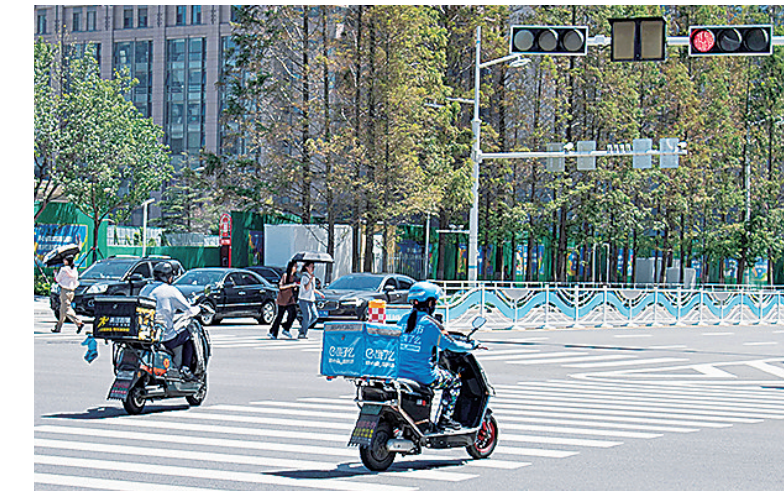
■两名骑手闯红灯通过松岭路、苗岭路路口。

而非现场执法效果也有限。据介绍,道路上绝大多数的监控设备用于抓拍机动车违法行为。“目前,有些视频监控设备识别不了电动自行车、摩托车号牌。而且,电动自行车还存在号牌不统一、挂临时号牌、车主登记信息不准确等问题,通过车牌实施处罚尚有难度。”交警崂山大队指挥中心的民警说,非机动车驾驶员不需要办理驾照,对于非机动车闯红灯、逆行的违法行为