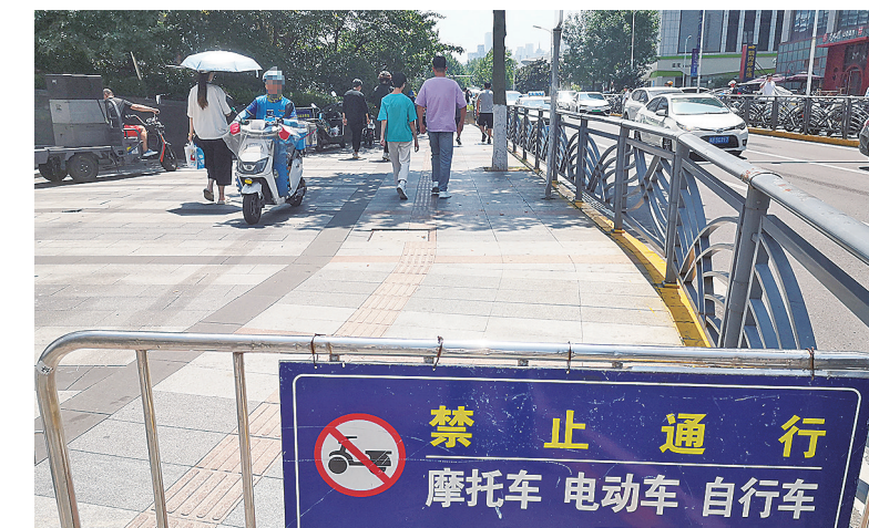
■骑手在徐州路东侧人行道的禁行路段行驶。