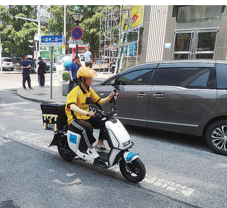
■骑手逆行进入漳州二路。

记者在市北区敦化路、徐州路路口看到,虽然徐州路东侧的人行道上立有“摩托车、电动车、自行车禁止通行”的警示牌,但骑手依然在此争道抢行。记者细数,30分钟内有多40多辆外卖车辆进入该路段。不少外卖骑手急于送餐,持续鸣笛提示路人躲闪让路。