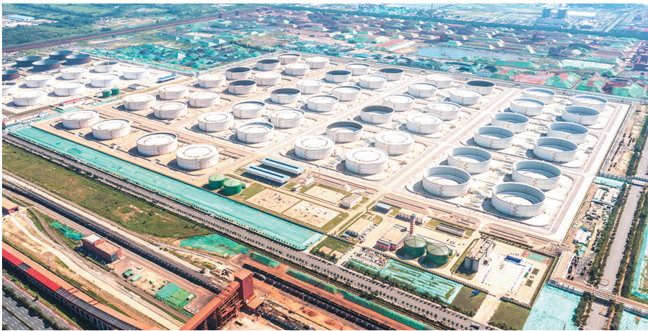
■董家口原油商业储备库项目总库容520万立方米。

本报8月23日讯 23日上午,山东港口青岛港董家口原油商业储备库(三期)投产仪式举行。至此,董家口港区原油商业储备库一期、二期、三期工程共计520万立方米原油储罐及配套设施工全部建成投产,标志着全国沿海港口单体容量最大的油品库区由工程建设阶段转入生产运营阶段。项目投产后,董家口港区已建成投产的原油库区罐容设计年存储能力突破1106万立方米,服务山东区域和内陆腹地经济发展能力进一步提升。董家口港区原油商业储备库项目是山东省和青岛市新旧能动转换重点项目,总库容520万立方米,总投资超49亿元,共分为三期建设。一期建设16座10万立方米浮顶油罐以及配套工艺泵房、变电所等辅助生产设施,二期建设24座10万立方米浮顶油罐,分别于