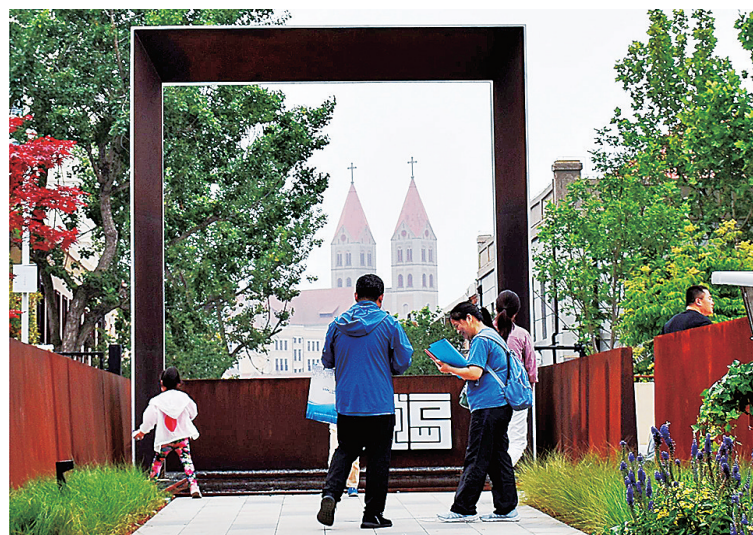
■游客在浮岛公园“最佳打卡点”游览。

随着RCEP先行创新试验基地、人工智能产业集聚区、胶州湾科创新区启动区等崛起，这处蜿蜒的海岸线既成为一条新的以产业办公为主体的临海建筑界面，又因为设计巧思成为市北区又一高颜值的打卡地。