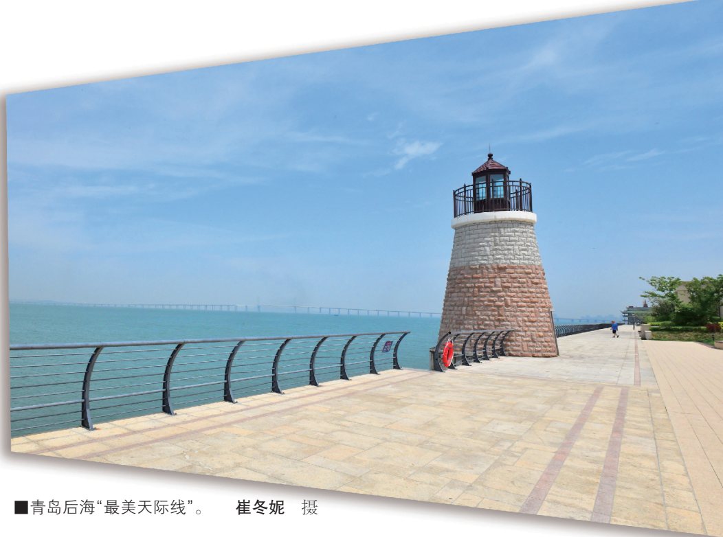
■青岛后海“最美天际线”。