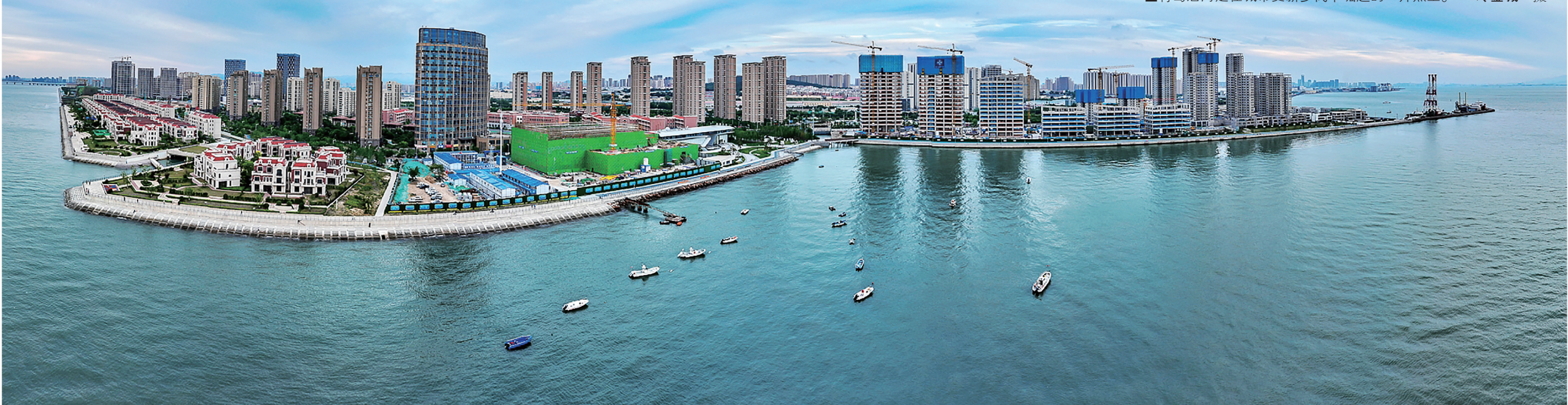
■青岛后海是在城市更新步伐中崛起的一片热土。