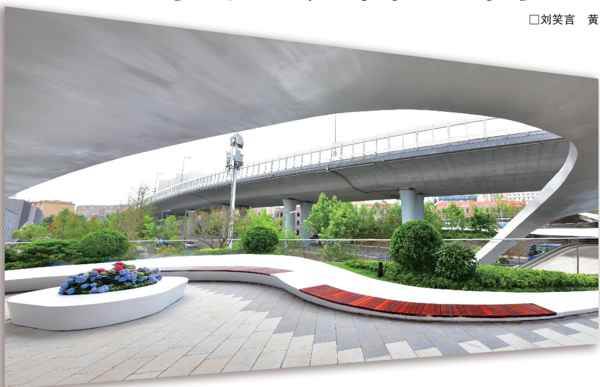
■浮岛公园天空的弧线与“琴键”相和，仿佛流淌着一首美妙的乐曲。