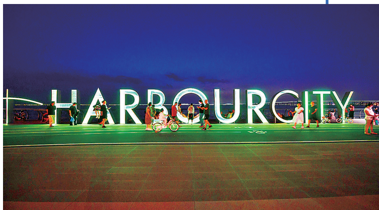
■市北滨海步道成为市民健身、休闲的好去处。