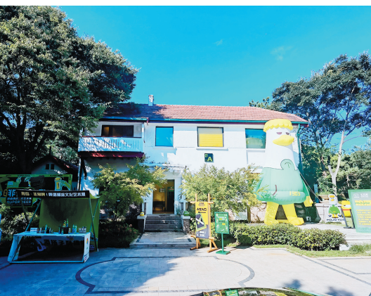
■位于太平角一路的太平角18号艺术中心。