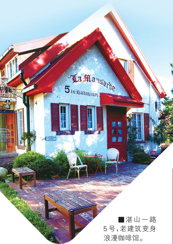
■湛山一路5号，老建筑变身浪漫咖啡馆。

庭院文化深刻呈现出优质IP的高附加值，激发出老建筑历史文化底蕴的鲜活生命力，“老瓶装新酒”的文艺微醺令人着迷又回味无穷。