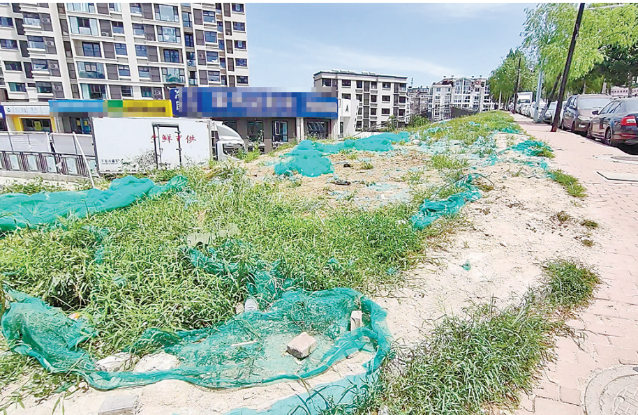
■市北区瑞昌路、顺昌路路口西侧的一处地块杂草丛生、环境脏乱。

为何采取了措施，排水依然不畅？记者近日拨打了城阳街道农业农村服务中心的电话，工作人员介绍了新情况。“今年，我们多次到现场研究解决办法，一开始判断排水不畅是明渠和暗管堵塞所致，但施工人员在疏通地下暗管时发现，实际情况与前期预料的不一樣，情况更为复杂。”该工作