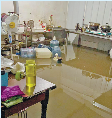
■8月6日，雨水倒灌进企业的一间厨房。