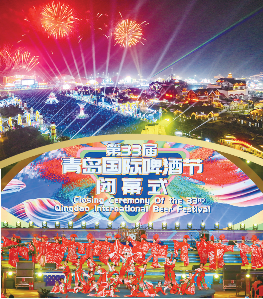
■8月6日，闭幕式演出现场。