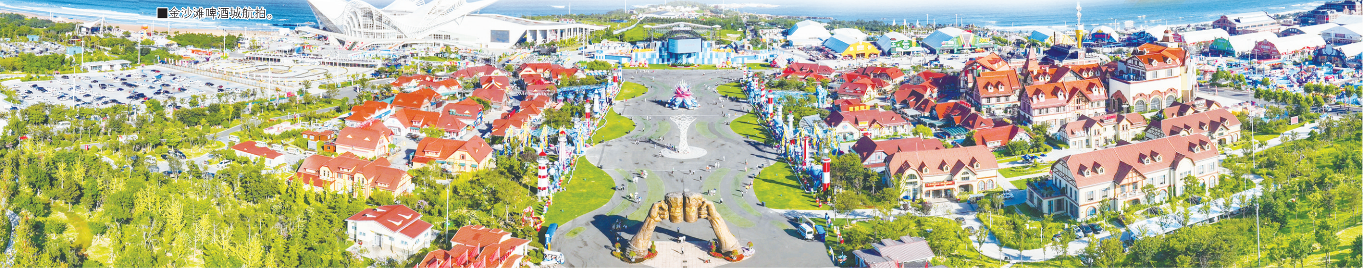
■金沙滩啤酒城航拍。

以“一座城”激活一座城。西海岸新区正以金沙滩啤酒城为纽带，辐射带动其他节庆、夜市、商街、景区“串珠成链”“聚链成群”，踔出一条以“啤酒+”多元链接的城市发展之路。