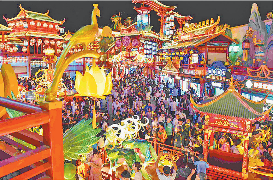
■红岛火车站附近的青岛“不夜城”灯火辉煌。