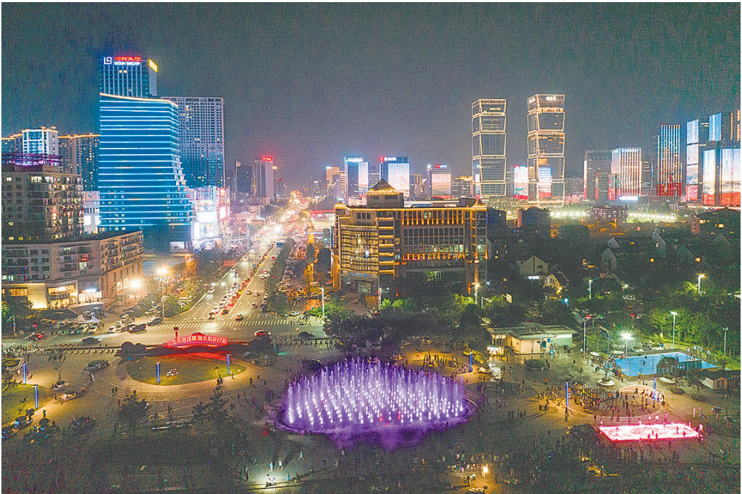
■金家岭商圈夜色璀璨。