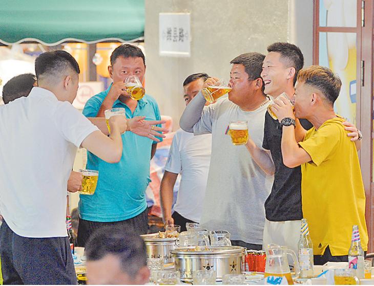
■市民游客在上街里啤酒节上开怀畅饮。