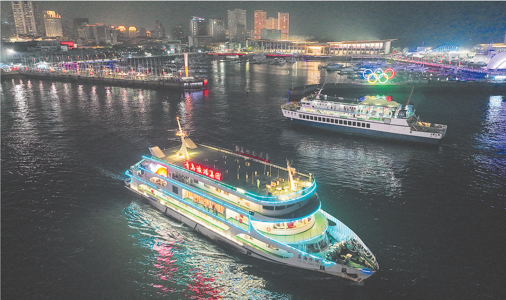
■彩灯闪烁的游船在浮山湾海面往来穿梭。