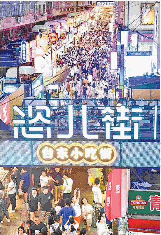
■市民游客在台东商圈“恣儿街”品尝美味小吃。

夜幕低垂，华灯初上，城市换上霓虹妆容。潜藏在青岛夏夜里的精彩拉开序幕，火热的夜经济如夏日热浪扑面而来。 烟火可亲，诗意可寻。台东夜市、李村夜市、吕家庄夜市……烟火蒸腾中尽显市井生活。伴随台东三路步行街在城市更新中改造升级，昔日的美食小巷华丽变身，“恣儿街”新招牌闪闪发光。清凉夏夜，市民和天南海北的游客在此汇集，共同品尝独具特色的美味小吃，感受城市夜晚的味蕾律动。 无啤酒不夏天，青岛国际啤酒节如约而至。避开炎炎烈日，夏夜凉风习习，嗨“啤”一夏，“鲜”吃为敬。从西海岸会场、崂山会场的宏大场面，到各区市的特色主题活动，国际大牌啤酒就着现场加工的海鲜，酒香和美味弥漫在城市夜色里。 城市没有黑夜，璀璨灯火照亮海面。从石老人浴场到奥帆中心，从浮山湾畔到栈桥之滨，沿海街区灯牌林立霓虹闪烁，沿街商铺鳞次栉比。在夏夜里升腾的烟火气，伴着海浪与月光唱和。动人心魄的无人机表演、精彩绝伦的灯光秀、美轮美奂的游轮……浪漫“国潮”与国际时尚风，弥漫在激情无限的夜色里。 夜经济点亮了夜生活，夜生活带火了夜经济。近年来，“夜经济”是各地促消费政策中的高频词，成为备受关注的发力点。在《中国城市夜经济影响力报告(2021-2022)》中，青岛名列“2021年城市夜经济影响力排名”榜第三位，位居重庆、长沙之后，跻身头部城市行列。夜游、夜景、夜秀、夜市、夜娱……推动新业态向品质化、专业化、产业化方向优化升级，青岛无疑已经走在了全国的前列。 夜经济是市场的新引擎，是经济社会活力的新脉搏，更是市民生活日益丰富的剪影。青岛，正以不断更新的“夜”态，勾勒出城市越夜越精彩的模样。