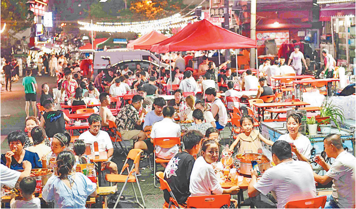
■营口路周边的啤酒大排档吸引了众多市民游客。