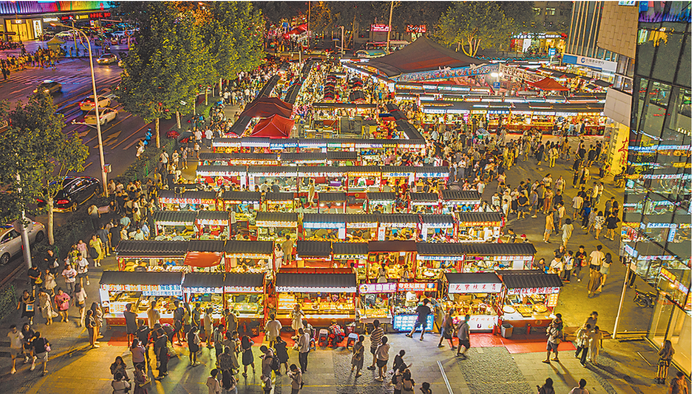
■李村商圈夜市人头攒动。杨志文 摄