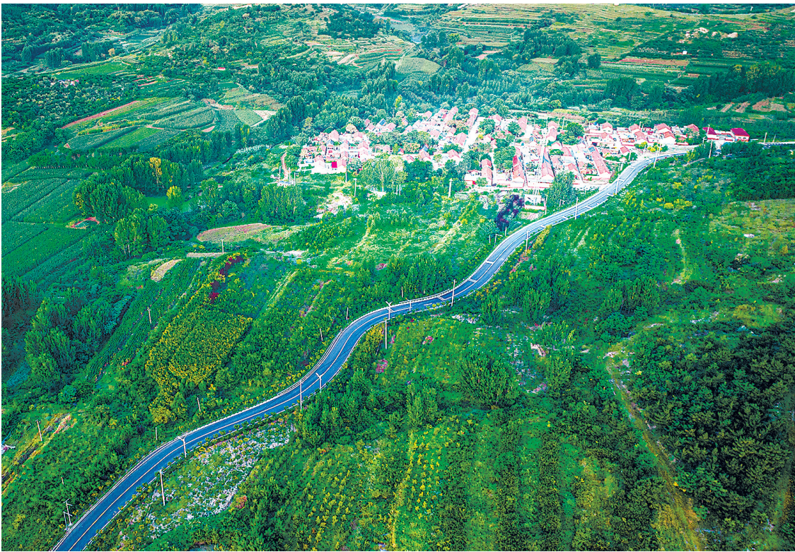
▲西海岸新区大村镇韩家庄水库。