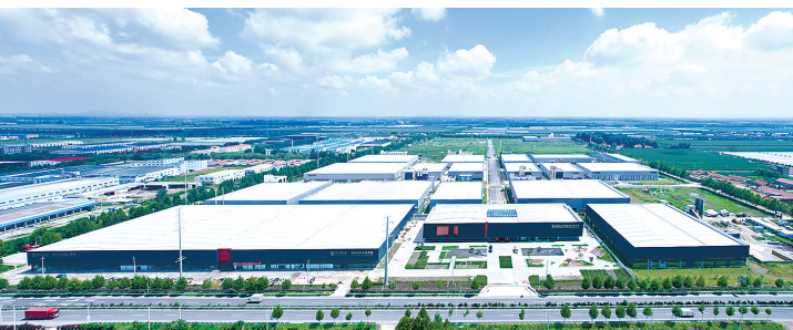
■平度市夏格庄镇工业园区。