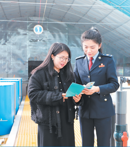
■税务部门工作人员到企业进行涉海税收政策宣传。

优化营商环境是培育和激发经营主体活力、增强发展内生动力的关键之举。今年以来，青岛税务部门聚焦政策落实提速、重点服务提档、诉求响应提效、便捷办理提质、规范执法提升，上下齐心同频发力，各项服务举措正逐步落地见效。