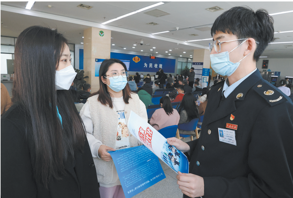
▲税务工作人员向纳税人介绍“便民办税春风行动”的创新举措。