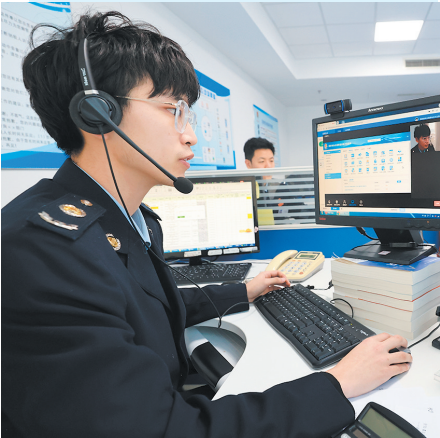
■青岛税务部门创新推出“答办通、云线通、询访通”的“三通一体”智慧服务新模式。