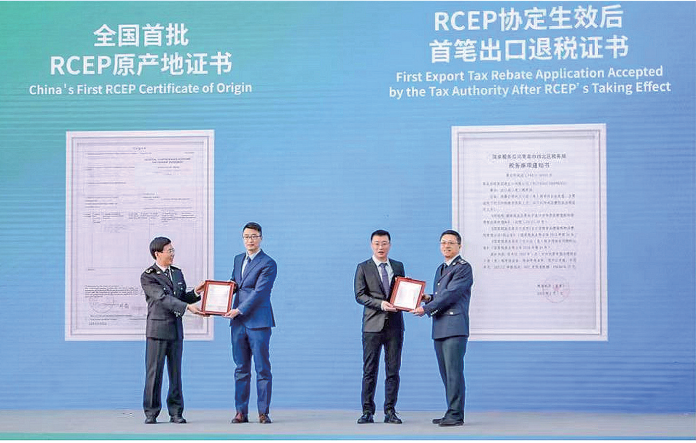
■2022年1月1日,在RCEP生效落地青岛启动仪式上,青岛开出全国首份RCEP原产地证书、受理首笔出口退税申请。

开放的青岛,又一次站在世界的聚光灯下。 6月28日至30日,2023年RCEP经贸合作高层论坛在青举办,RCEP成员国有关政府部门官员、驻华使节、贸易投资促进机构和商协会代表、经贸领域专家学者以及企业代表齐聚一堂,就RCEP与亚太区域经济一体化发展、国际航运贸易便利化、区域内产业链供应链融合发展、数字经济和绿色经济新机遇等议题探讨交流。 值得一提的是,6月2日,全球规模最大的自由贸易协定《区域全面经济伙伴关系协定》(RCEP)正式对菲律宾生效实施,至此,协定对15个签署国全面生效,标志着全球人口最多、经贸规模最大、最具发展潜力的自由贸易区进入全面实施新阶段。 本届论坛是在RCEP全面生效实施当月,首个以RCEP为主题的国际性、高层级会议。和往届不同,本届论坛增设了投资贸易洽谈会板块,邀请RCEP成员国使领馆相关部门、机构、国内外商协会、企业,聚焦国家产业优势,宣传投资政策环境,推介重点企业,开展经贸洽谈。 正如论坛主题——“携手前行 共促繁荣”,如何在更广阔的市场中,打造国际经贸文化交流与高端商务要素集聚平台和特色载体,促进“流量”变“留量”,成为本届论坛的必答题。