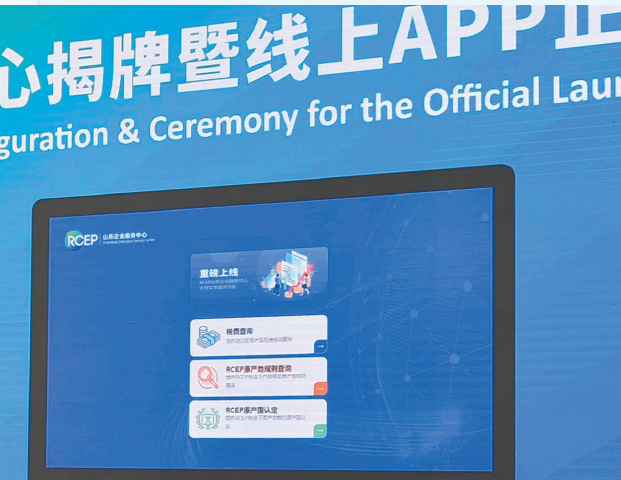
■2022年1月,RCEP山东企业服务中心APP上线。