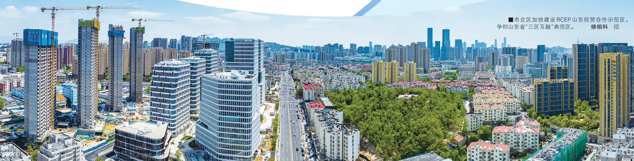
■市北区加快建设RCEP山东经贸合作示范区,争创山东省“三区互融”典范区。