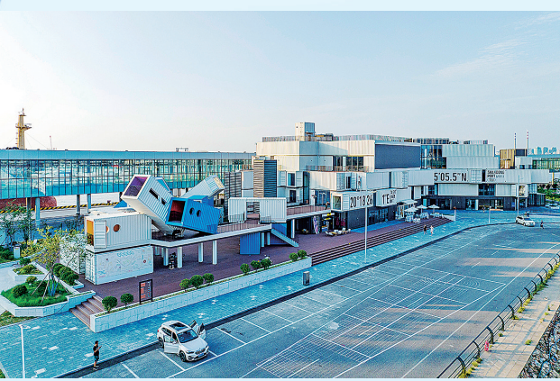
■TEU集装箱部落等一批商业文旅项目相继落地。