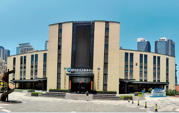
■RCEP山东企业服务中心。