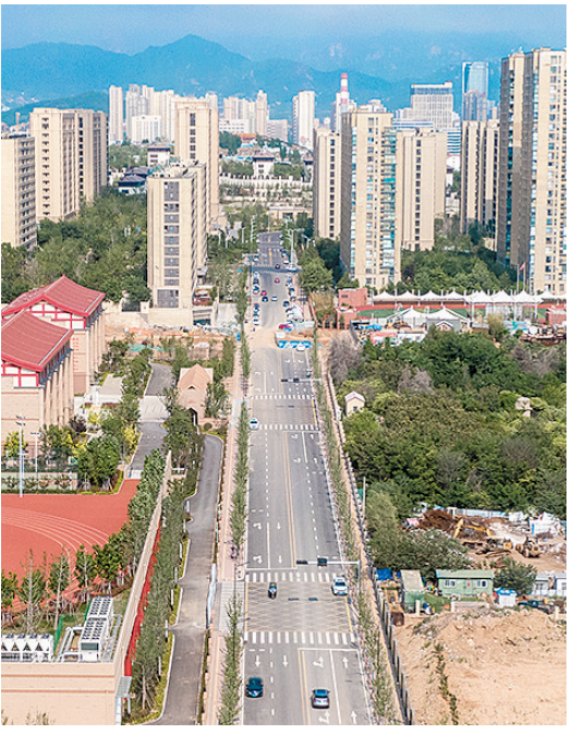
打通后的合水路。