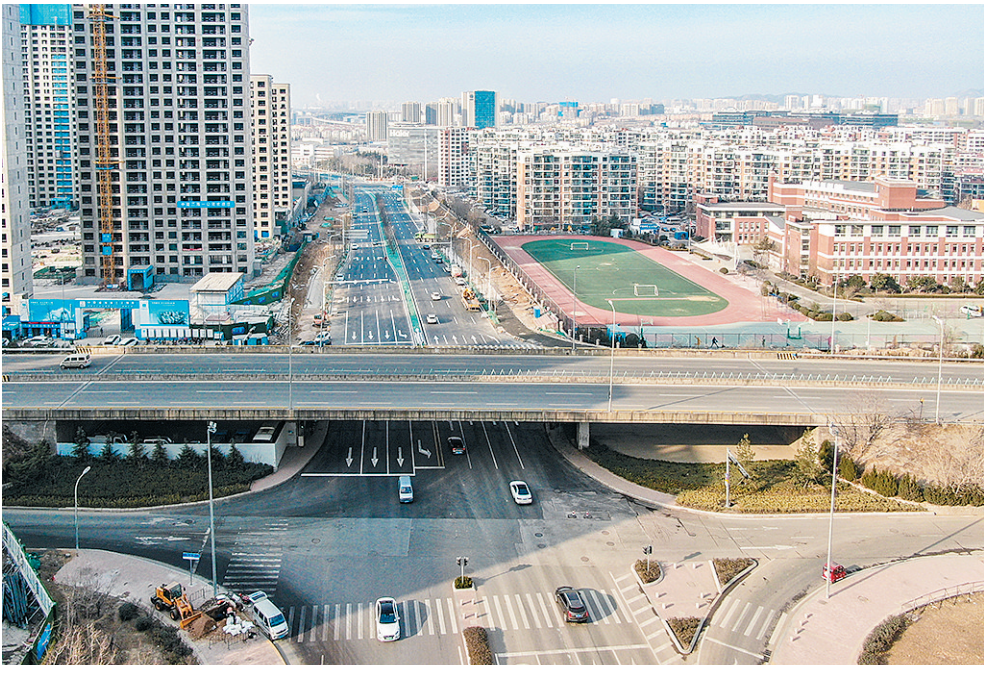
打通后的劲松五路。