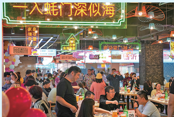
■市南深受欢迎的“大排档”。