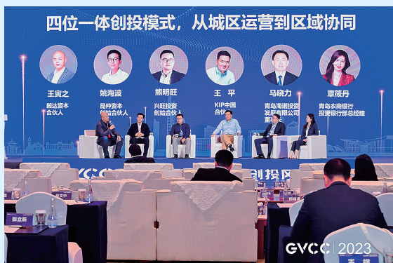
■市南区广泛招引创投风投机构落地。