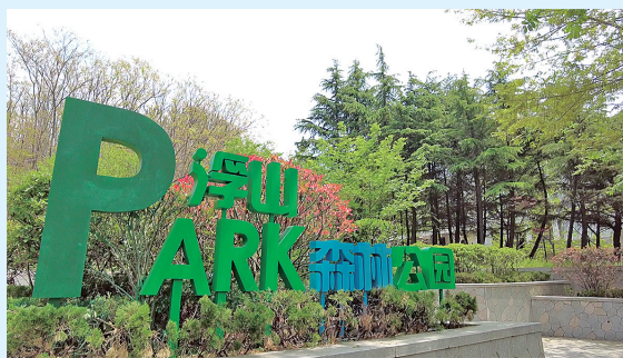
■浮山森林公园。