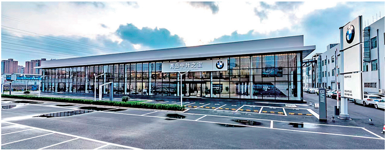
■中升汽车智慧产业园内汇聚众多汽车品牌4S店。

税收指标完成年度目标的32.01%，位列全区前茅；社会消费品零售总额一季度贡献度38%，增速29.1%，超过全区引导预期；外贸稳提质增幅100.93%；规上工业增加值及增速和GDP等指标也较上年有较大增长……这是一份李沧区兴华路街道今年一季度的成绩单。今年以来，兴华路街道积极发挥党建引领作用，将经济发展列为各项工作之首，规划布局四大产业园区，加大项目招引力度的，不断优化营商环境，促进项目提质增效，一季度各项经济指标取得新突破。