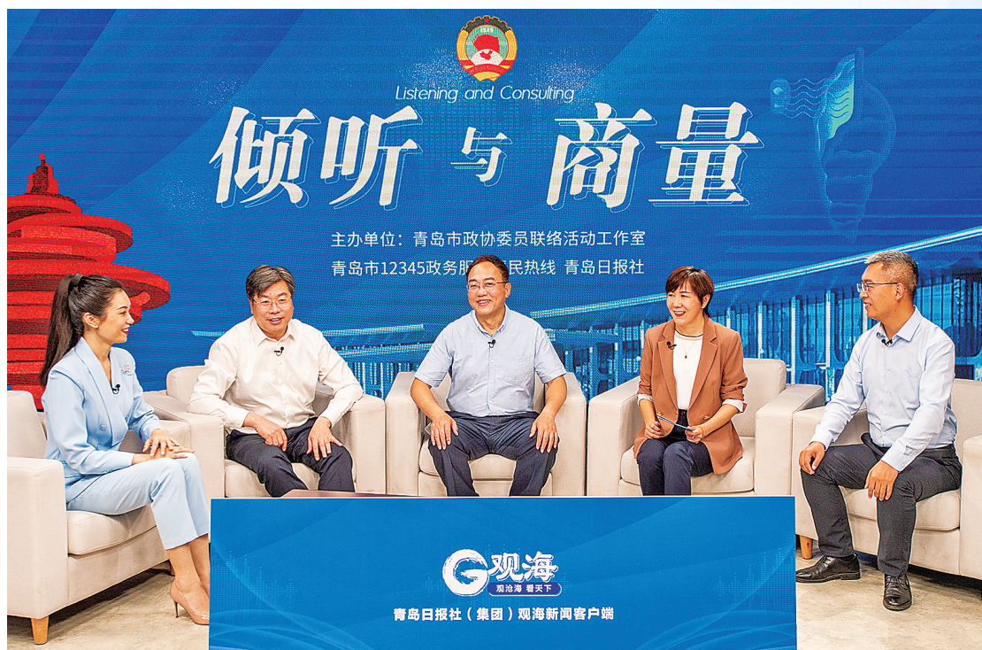
■嘉宾围绕“大力推动智能建造，打造城市更新建设新示范”主题展开协商。

●要以工程全生命周期整合产业链，加强系统化集成设计，实施精益化生产施工，把装配式建筑的各项优势发挥出来。