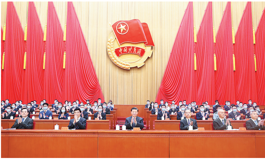
6月19日,中国共产主义青年团第十九次全国代表大会在北京人民大会堂开幕。这是中共中央总书记、国家主席、中央军委主席习近平在主席台向与会代表致意。