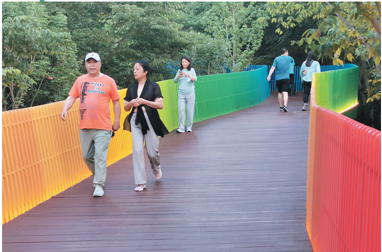
■市民到彩虹栈道散步休闲。