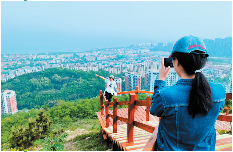
■浮山绿道蜿蜒绵长,年轻人相约来此登山打卡。