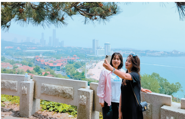
■在小鱼山公园合影留念。 韩 星 摄