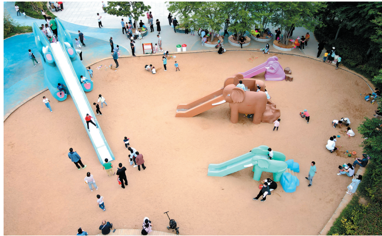
■象耳山公园是亲子集会的好去处。