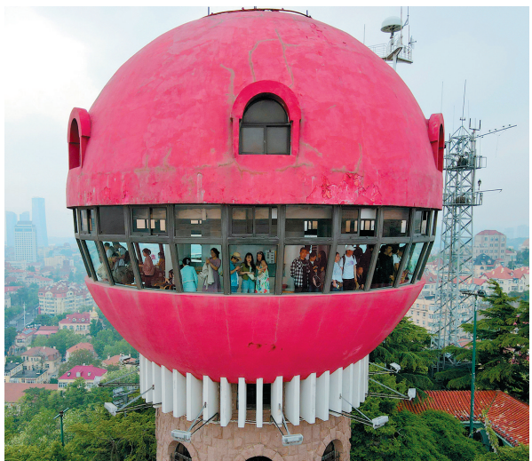
■市民和游客登上信号山公园蘑菇楼俯瞰老城风光。