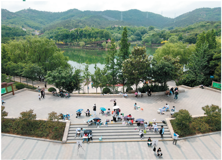
■秀美的老虎山公园吸引了美术院校师生来此写生采风。