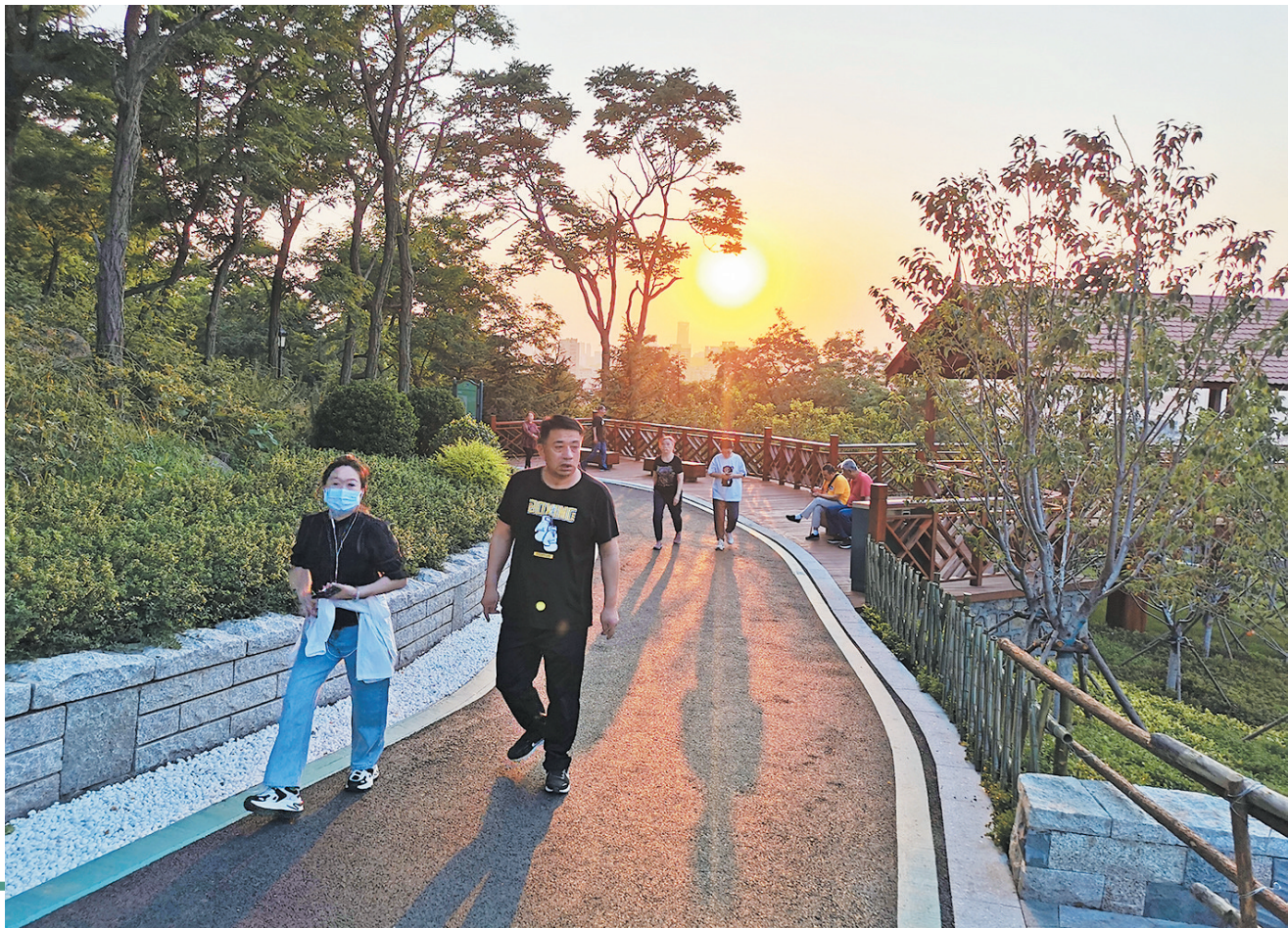
■金色夕阳映照下的太平山绿道。