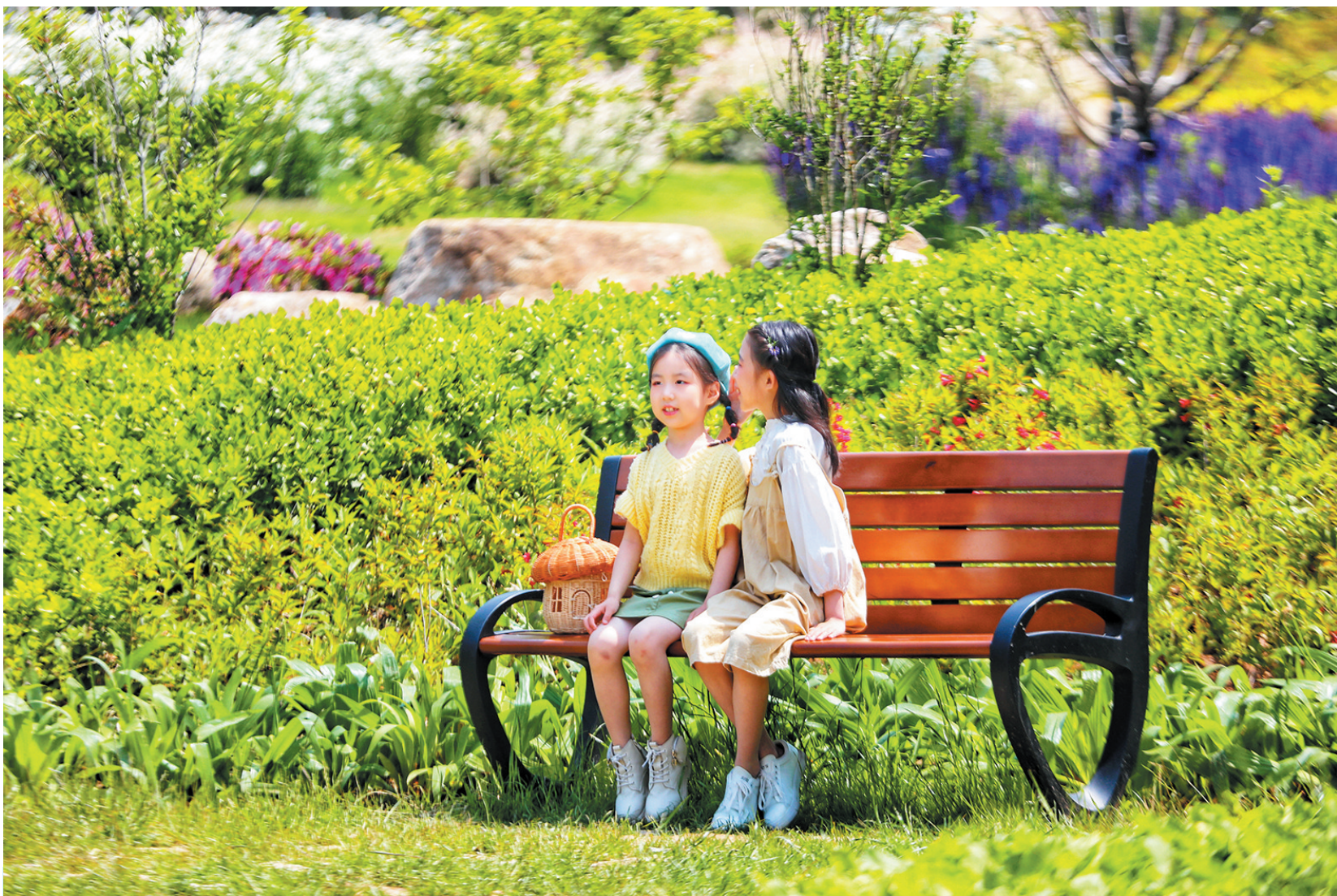
■一对小姐妹在花溪谷长椅上说着悄悄话。

浅夏时节,绿意盎然。 青岛,一座独具风韵的城市,山海城浑然一体,红瓦绿树交相辉映,万国建筑争奇斗艳,新老城区相得益彰。坐拥得天独厚的自然资源,2022年,青岛开启了公园城市建设三年攻坚行动。一年多来,60个山头公园相继完成整治提升,一处处依山而建的公园绿地令人赏心悦目,让“推窗见绿、出门入园”的梦想照进现实。 在太平山中央公园,全长7.9公里的太平山绿道,串联起中山公园、动物园、榉林公园、植物园,一条绿道看遍满山风景,成为市民休闲健身的绝佳之地。 小鱼山公园如油画般的美景吸引着游客打卡晒图。小鱼山因势谋景,以景造型,将山、林、廊、阁相结合,融合独特的自然与建筑之美,这里是游客心中的“莫奈花园”。与之遥相辉映的信号山,前临大海,背依市区,是观赏前海景区和市区风貌的最佳 viewpoints 之一。 在燕儿岛公园,沿着海边木栈道听海浪拍岸,看夕阳西沉。蜿蜒曲折的小路,错落有致的景观……浑然天成的气质自带画框和滤镜。 象耳山的“网红滑梯”成为市民遛娃的好去处;集生态保护、观光游憩、休闲娱乐、人文展示等多功能于一体的老虎山公园,为写生、摄影提供了“素材”。 新建生态绿道、升级园内景观、增加活动设施……随着青岛不断对山头公园整治提升,将游览赏景、休闲健身和亲朋互动融为一体,山头公园成了市民“家的延伸”,成了大家的“会客厅”。 依托“山、海、城”自然生态基底,今年,青岛还将启动7个山头公园建设,拆除私搭乱建,实施生态修复,建设登山步道和休闲设施,增强绿化景观功能,为市民提供更多的休闲空间,让“会客厅”越来越多。