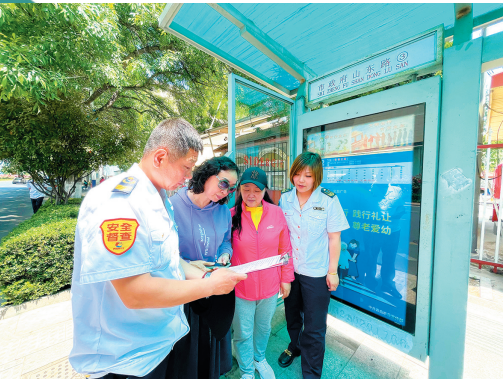
■“青岛巴士”志愿者上站点深入调查研究,问需于民。

通过建立全产业链协同体制机制,共同体将对第一要素无法实现的技术难题,有计划有组织地吸引产业链优质创新要素的深度参与,解决单个创新要素干不了、不愿意干、干不了不划算的问题,不断延链补链强链,促进船舶产业转型升级、做大做强。