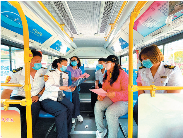
▲402路与地铁无缝接驳,方便市民绿色出行。