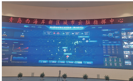
城市云脑指挥中心。

业和作业完成率自动化监管；通过车载芯片识别装置，做到混装混运实时感知和监管。在分类处理环节，统计全区生活垃圾处理量、生活垃圾回收利用等指标，定量、动态评价垃圾分类工作开展成效；开发“云上巡检”场景，建立垃圾处理设施“数字孪生工厂”，从安全、计量、环保方面，对处理设施实时监管。在考核评价环节，开发“评估分析”场景，对镇、街、行业牵头部门、机关企事业单位4类机构130家单位工作成效进行评估分析，实现全区垃圾分类工作量化评估、分级分类指导。