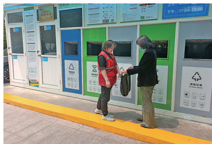
观海苑小区创建垃圾分类共治共享“心”模式。

“认真”，要求建立高质量垃圾分类推进长效机制，社区党组织发挥引领作用，成立垃圾分类居民自治小组，对新投放点增加保洁频次，加强与收运单位联系，设立垃圾分类“红黑榜”，小区垃圾分类变化由表及里。