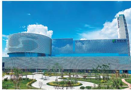
西海岸新区静脉产业园外景。

产业园焚烧发电项目设计日处理能力2250吨，年上网电量约3.7亿度，可满足10万户家庭的年用电需求；渗滤液处理中心，日处理规模1300吨，年产生沼气400万立方米；厨余垃圾处理中心，日处理规模100吨，用于处理非居民厨余垃圾；飞灰填埋场，库容119万立方米，可满足30年的填埋需求；炉渣综合处理中心，每年可生产17万吨建筑骨料。焚烧厂配套建设垃圾分类宣教基地，面向社会开放，目前累计接待近万人次，每年有2000余名学生到项目实习。