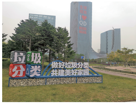
唐岛湾公园垃圾分类主题景观。

可近绿、亲绿，席地而坐拥抱大地。同时，依托由3万多只塑料啤酒瓶构建的“啤酒森林”景观，就近植入雕塑“悠游海洋”、雕塑“共同体”、“垃圾降解时间方块”、“旧物新姿营地”、“童趣空间”等垃圾分类主题景观和互动装置，市民在游览同时学习垃圾分类知识，让垃圾分类理念深入人心。