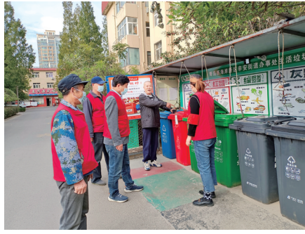
铁路小区垃圾分类现场。

自我监督：强化业委会、物业公司自身建设，建立房东承租租户垃圾分类连带责任机制，设立垃圾分类“红黑榜”。