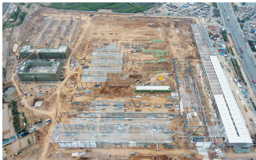
■潍柴(青岛)智慧重工智造中心项目二期正全力冲刺6月钢结构主体结构全面封顶的工期目标。