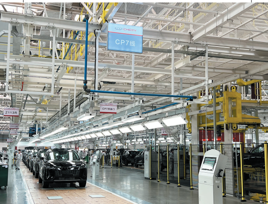
■奇瑞汽车青岛基地是奇瑞集团最先建成并实现量产的超级工厂。