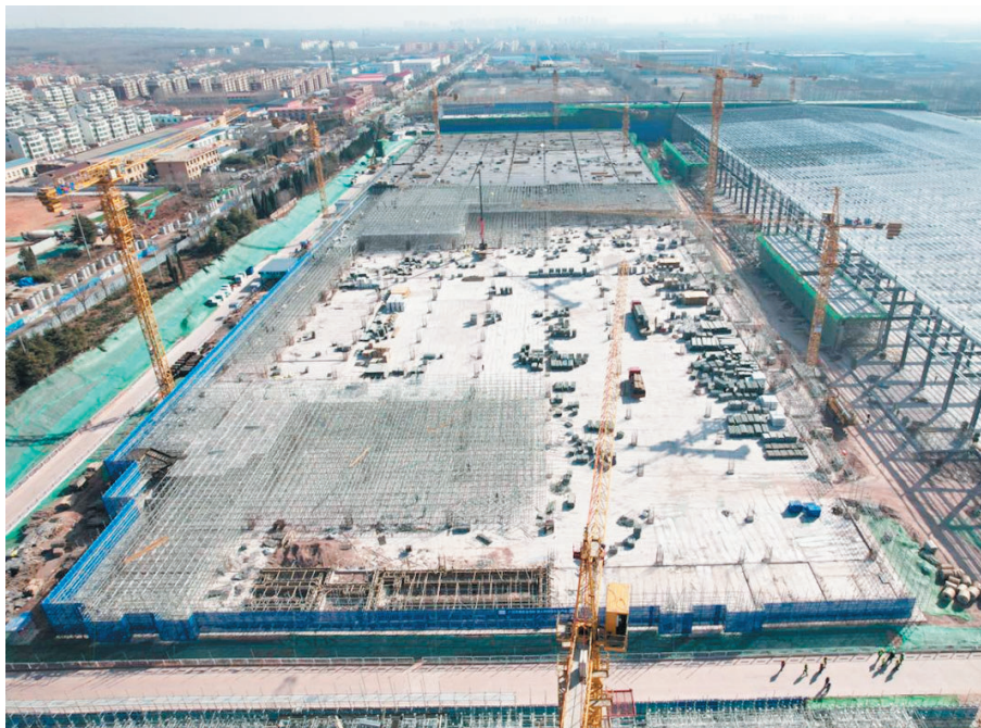
■海尔冰箱智能制造一期项目现场。