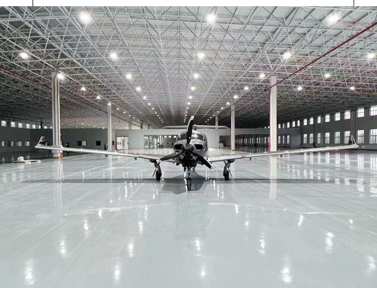
■全球首架“青岛造”万丰钻石DA50飞机。