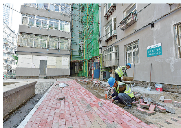
■人民路235号老旧楼院正在铺设新地面。

项目将打造特色功能活动场地10余个，增加健身器材、文化廊架及座椅条凳，在拆违、清理杂物、绿化整治的同时，打造海棠园、玉兰园、樱花园、紫薇园、梅园5个不同的主题绿化园区。