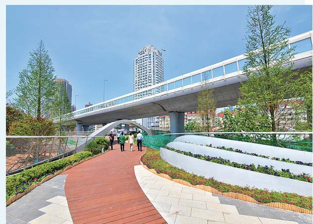
■浮岛公园实现人车分流立体化交通。

“浮岛”结合桥面及地面空间进行景观布置与绿化提升，在满足交通需要的同时，兼顾居民休憩、观赏以及城市形象展示等城市功能需求，力求实现城市公共设施公益便民、活力赋能、艺术趣味等综合效益。项目建成后将提升中山路地铁站、李村路停车场、聊城路停车场及体育中心等新建公共设施通达便捷性，进一步激发南北两侧胶州路与聊城路商圈的活力与潜力，并衔接辐射到中山路北端与馆陶路南端区域。