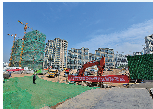
■同德路小学建设现场。

绿道沿线结合适宜改造提升的开敞地块，以及现有观景台、水面等资源设置休闲场地、观景台等各类节点，建设功能不同的驿站场所，其中，新建一级驿站1处、二级驿站2处，独立公厕若干处。按照“做精、做细、做美、做韵”要求，市北区将打造“一径、四溪、九画、多景”，“一径”指浮山绿道，“四溪”包括芳汀溪、逸趣溪、源隐溪、凝萃溪，“九画”包括阳光客厅、探幽谷、桃花坞、桃花源、文翠湖、溪缘桥、凝翠潭、百花园、松林堂。