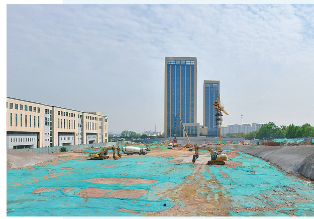
■百洋医药科技创业中心项目现场。

青岛健康谷规划占地面积383亩，将重点建设国际医疗贸易合作枢纽、国际开放交流平台、国家北方特色医疗中心，园区将围绕医疗器械、生物医药、数字医疗三个主导产业和健康服务一个配套产业，构建“3+1”生命健康产业全链条发展体系，并以龙头企业和产业平台建设为依托，围绕企业总部办公、品牌国际合作、金融创新孵化、人才创业、智慧社区，打造中国首个健康城市综合体。