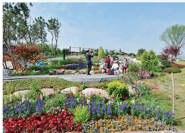
■浮山森林公园改造提升项目。

日前，市北区举行“项目落地提质年”重点项目观摩会，对10个观摩项目现场评议打分，借此动员全区上下比学赶超、加压奋进，贯彻落实市委“三条线”重点工作和加快打造“六个城市”以及“深化作风能力优化营商环境”专项行动部署要求，为全面建设繁荣美丽幸福的现代化国际城区塑造更多新优势。 据了解，市北区现有省级重点项目6个，一季度完成投资10.7亿元，完成年度计划的33.7%。市级重点项目16个，一季度完成投资30.5亿元，完成年度计划的52%，投资完成率列十区市第2位。区级重点项目82个，年度计划投资136亿元。一个个重大项目，一项项创新突破，比出了高质量，也赛出了精气神。