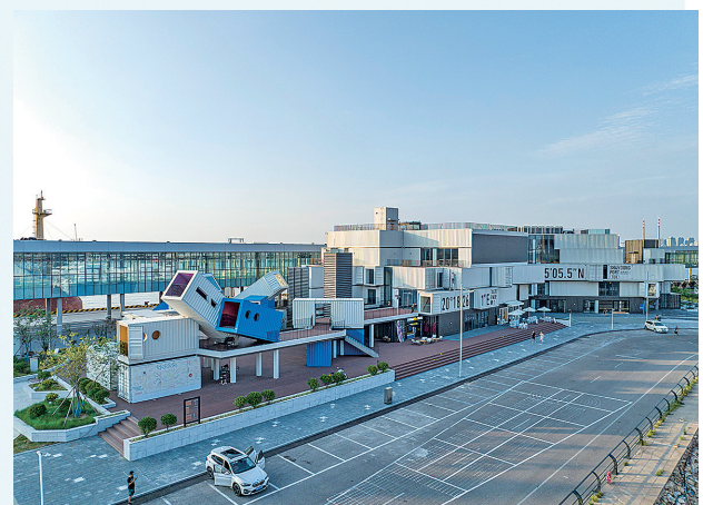
■集装箱部落已成网红打卡地。

项目位于市北区邱县路以西、青岛邮轮母港客运中心用地内，占地面积约15亩，规划建筑面积0.61万平方米。该项目是国内首个采用真实集装箱板安装施工的工程，打造集餐饮、娱乐、潮流为一体的时尚休闲综合体，为国内外游客、周边居民等提供全方位的一流消费服务。项目以开放、现代、活力、时尚的元素汇聚人气，加速整合时尚资源，为老城更新提供新动能，令老城焕发新的时代光彩。后续将以“集装箱部落”作为形象IP在山东范围内进行复制、形成市北区旅游业新“引爆点”。