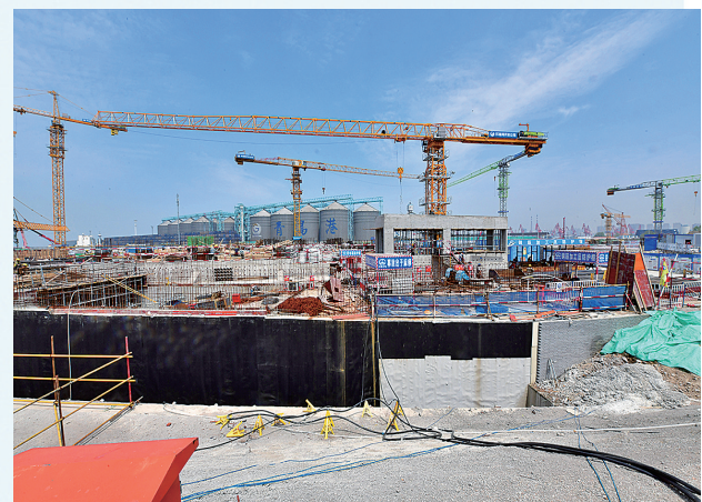
■中国北方国际油气中心加快建设。

项目建成后，由青岛聚港产业园投资运营有限公司进行产业园区运营，油气中心项目将发挥青岛能源交易中心和北方油气中心的平台功能，配套贸易和供应链金融服务，培育“交易+贸易+金融”产业生态，集聚青岛市各项优势服务要素，打造油气交易中心和油气产业综合服务平台。