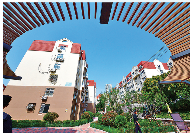
■中央商务区2023年老旧小区改造项目。

项目位于市北区劲松四路以西、同德路以北，占地面积约30.9亩，规划建设面积约2.94万平方米，规划建设30班小学，提供1350个学位。主要建设内容包括教学楼、体育馆、餐厅、厨房、停车场和室外配套工程等。项目建成后，将解决周边适龄儿童入学难题。目前，正在进行室内精装修收尾及室外回填，计划今年5月室内基本完工，6月竣工交付。