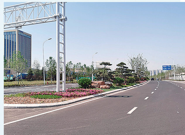
■唐河路工程实现主线通车。

该项目的建成将进一步完善青岛主干交通网，分担环湾路现状超饱和的交通流量，缓解重庆路、黑龙江路交通压力，同时促进周边地块开发建设，提升居民生活品质。此前，该项目在青岛市“作风能力提升年”活动中，作为城市更新和城市建设的“高质量发展项目”获得市委表彰。