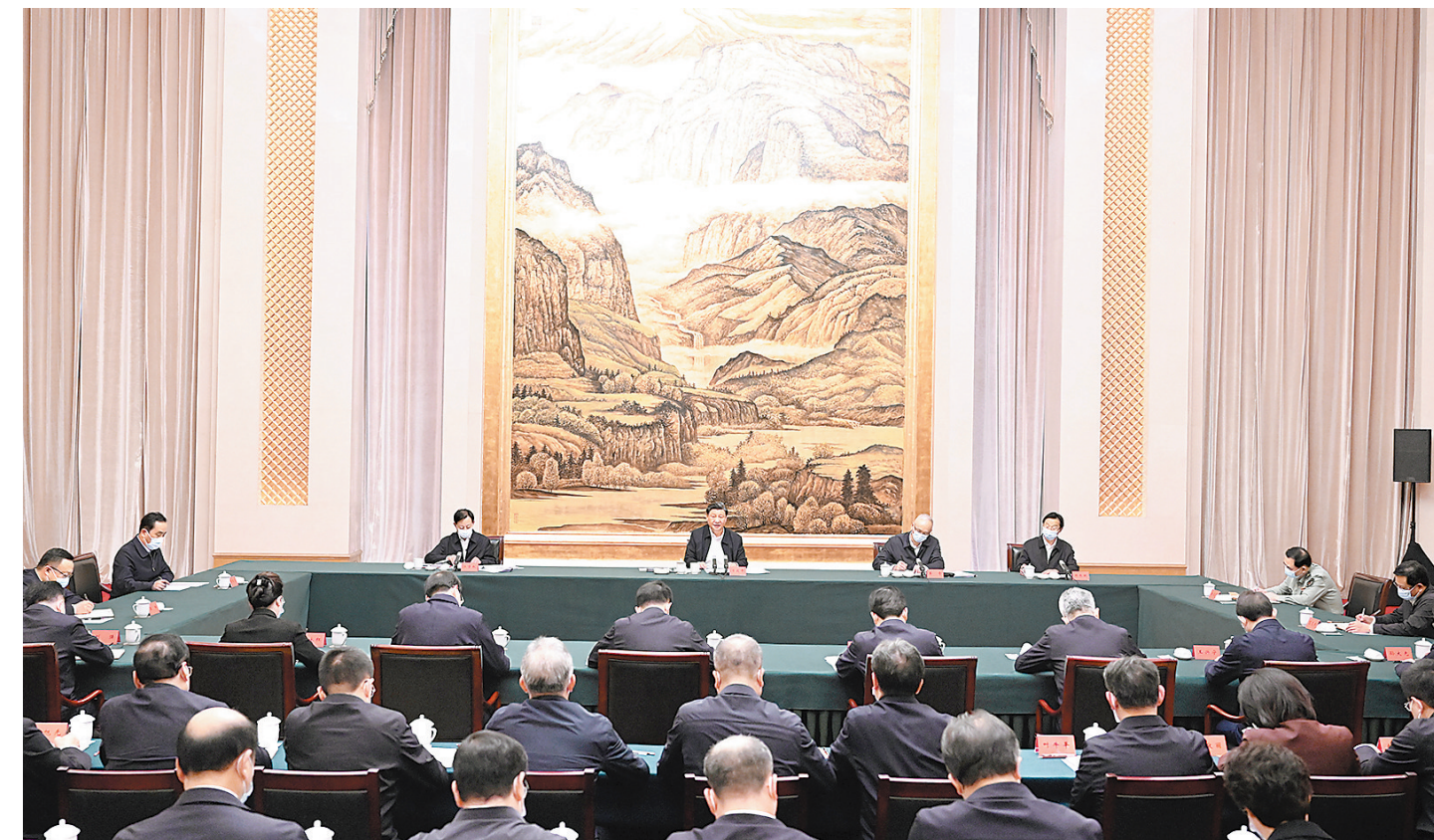
5月17日上午,中共中央总书记、国家主席、中央军委主席习近平在陕西西安主持中国-中亚峰会前夕,专门听取陕西省委和省政府工作汇报,发表了重要讲话。