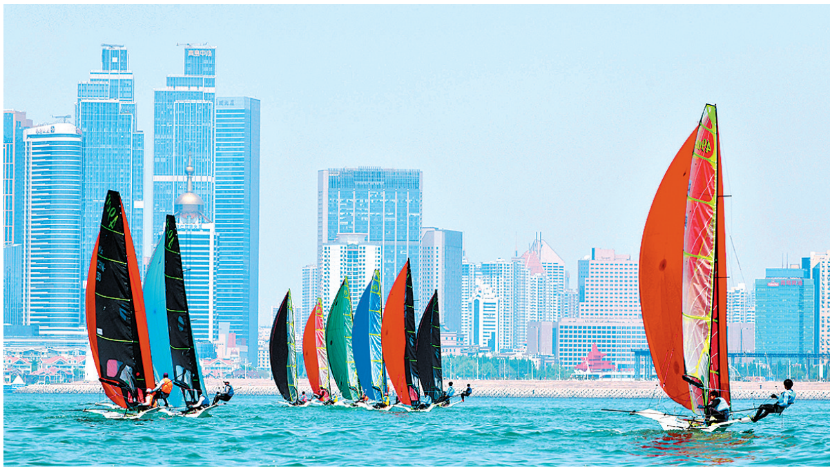
■5月12日,2023年全国帆船冠军赛在青岛扬帆开赛。

近年来,青岛相继举办中国家庭帆船赛、中国帆船城市超级联赛等国家级帆船赛事,展现出“帆船之都”的强大实力和赛事号召力。本次比赛在为国家选拔更多高水平的运动员,进一步提升我国帆船竞技水平的同时,也将加速推进顶级赛事与城市发展的深度融合,为青岛繁荣帆船事业、站稳亚洲帆船运动领军城市地位注入新动能。