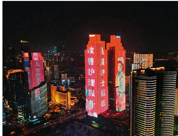
■5月12日晚,为庆祝第112个国际护士节的到来,浮山湾畔的中铁青岛中心大厦和华润大厦上演了护士节主题楼体灯光秀。