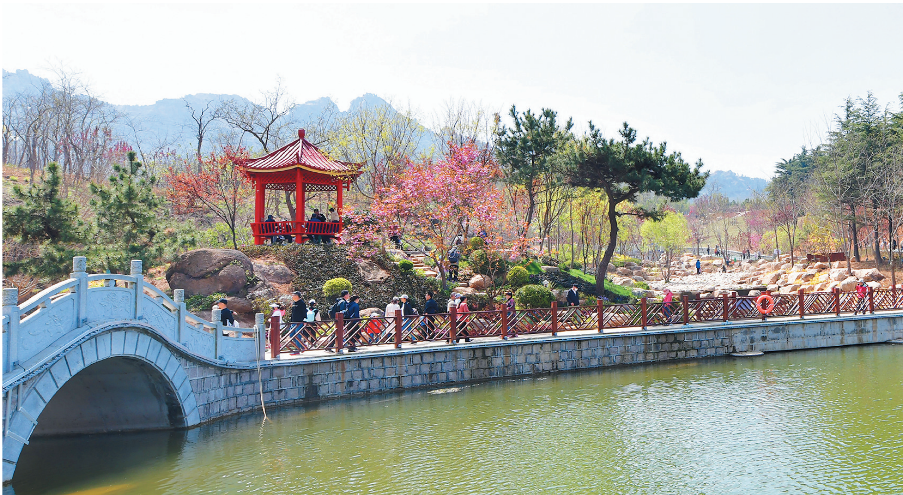
■浮山森林公园(市北)，长堤春水泛暖阳，游客宛在画中游。