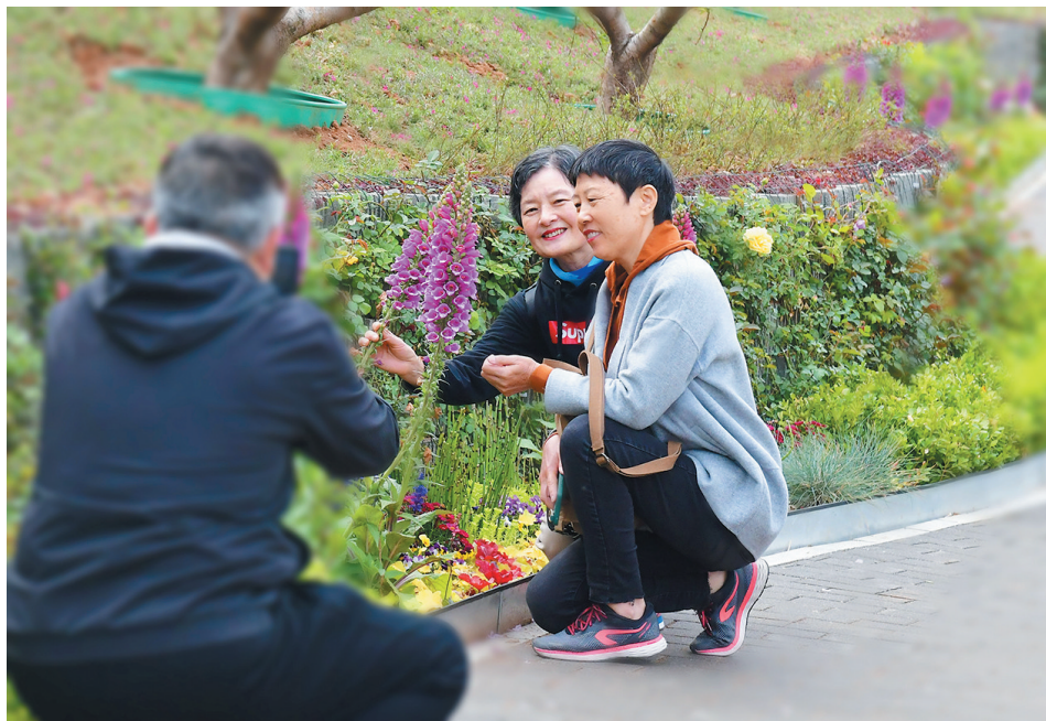
■灿烂笑容映春色。