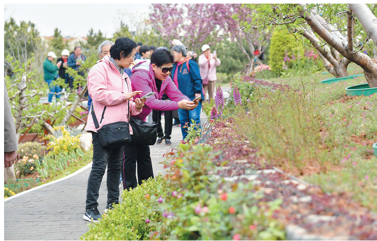
■游人醉于浮山春景之中。