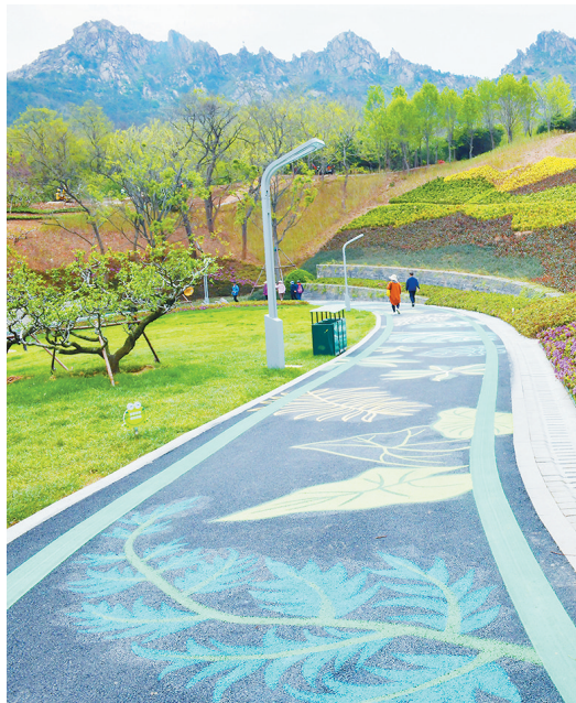
■浮山花田绿道曲径通幽。