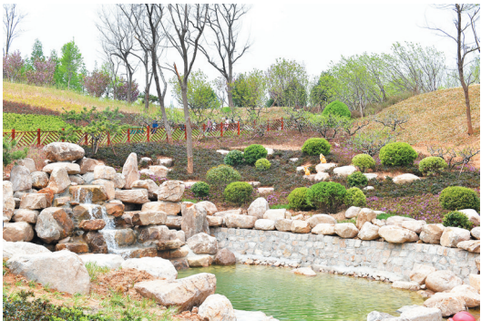
■浮山上，闻溪水声，如鸣佩环。