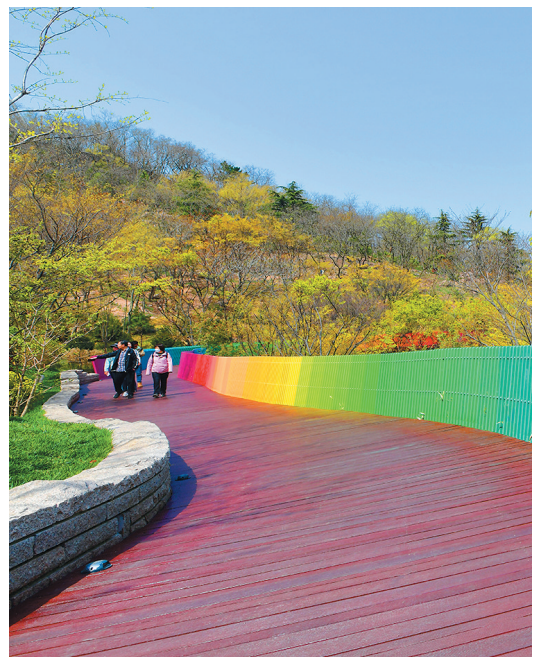
■太平山彩虹廊道。