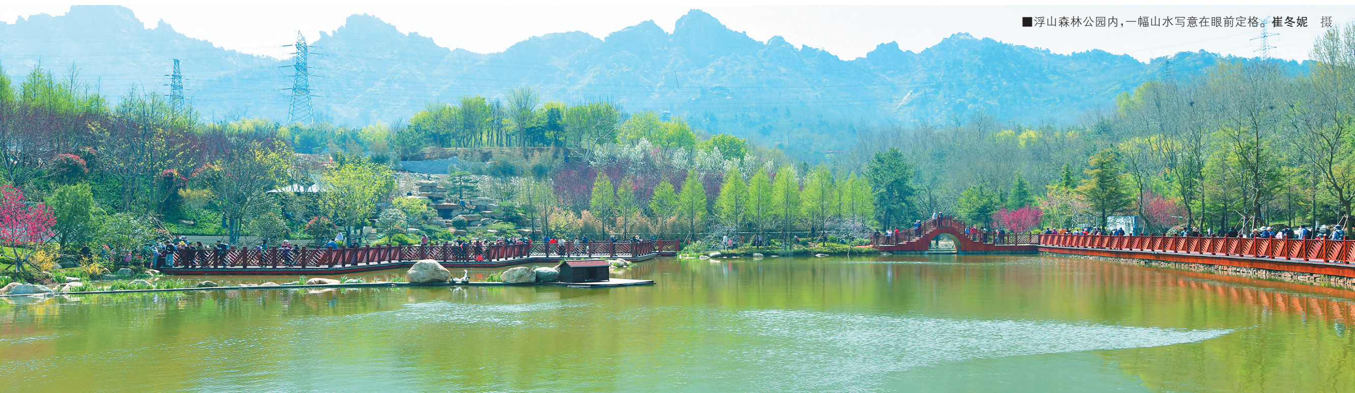
■浮山森林公园内，一幅山水写意在眼前定格。