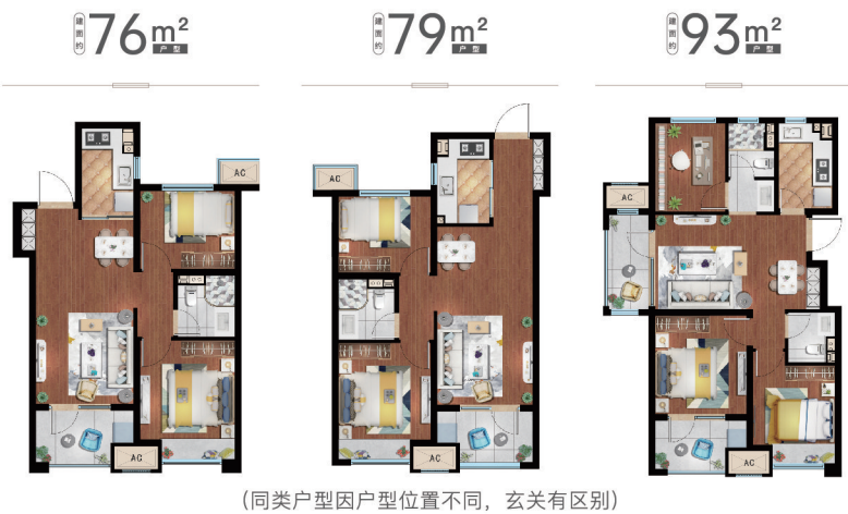
(同类户型因户型位置不同,玄关有区别)