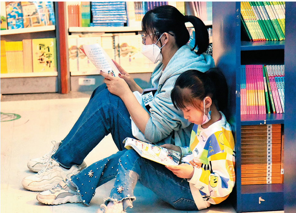
■在青岛书城,一位小朋友和妈妈一起席地读书。

启动仪式上,书香青岛Logo首次正式对外发布,标志着2023年青岛市全民阅读工程全面启动。全民阅读工程聚焦“书香青岛”和“艺术城市”建设,以满足人民精神文化生活新期待为出发点和落脚点,联动市全民阅读工程联席会议各成员单位和各区市,共同策划推出2023年青岛市全民阅读大会、“名师阅读大讲堂”、“汇泉讲堂”等线上线下系列活动300余项,满足广大读者阅读需求,不断增强市民对全民阅读的