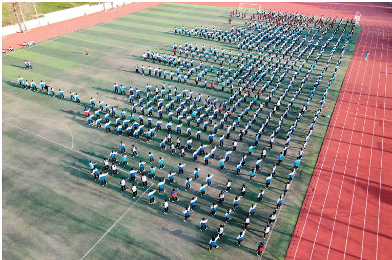
■莱西市职业中等专业学校的学生在操场锻炼身体。