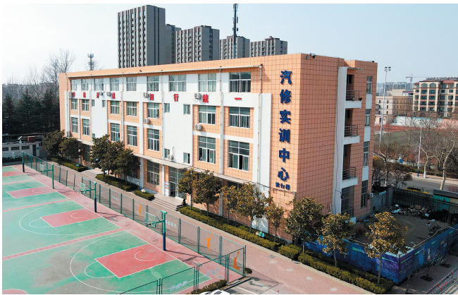
■莱西市职业教育中心学校。