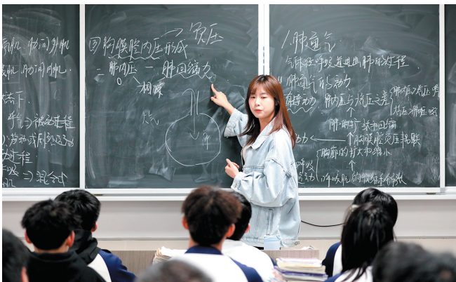
■学生们在青岛市现代职教园中上课。