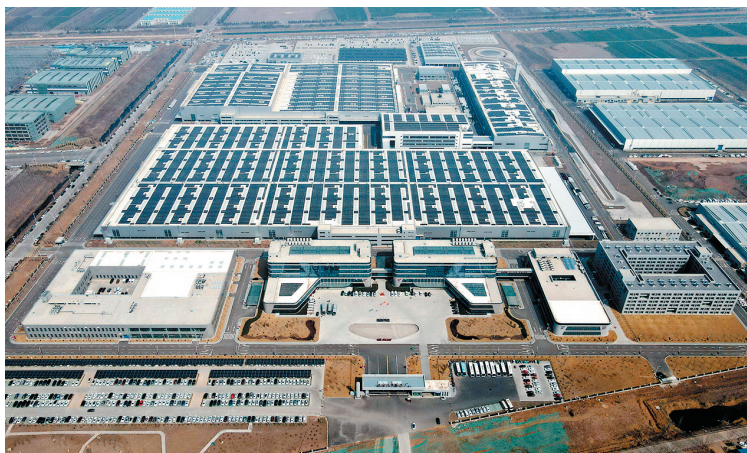
■位于莱西市姜山镇的北汽厂区。

城市产业发展需要什么样的人才,职业教育就培育什么样的人才。让教育链与产业链深度融合,莱西教育迈出了极具引领性的一大步。莱西市围绕青岛市龙泉-姜山产业组团规划,对接龙泉汽车制造产业集聚区、姜山新能源汽车产业集聚区发展需求,在莱西市姜山镇规划先进制造业职教的组团发展,建设现代职教园区,统筹布局建设高端装备制造、现代农业、商贸服务、汽车技术等三十余个专业群,与园区内新能源汽车等企业深度合作,形成“校企联动、校区联动、产校区一体化”发展格局。