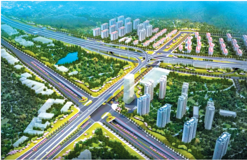
■青银高速公路增设唐山路互通及连接线工程项目效果图。

程量大,难度高;对既有高速公路、城市主干道调流施工周期长,协调、管理复杂;项目地处城市建成区,毗邻居住小区,环保、安全要求高的特点。项目开工当天,全线共计进场