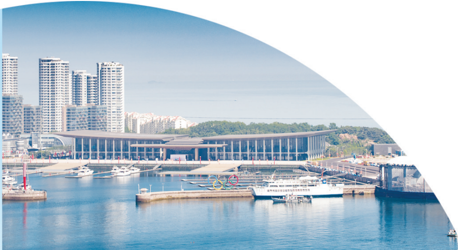
■国际会议中心是青岛重点展会、节庆活动的举办地之一。

这些高规格展会、节庆活动的陆续举办,释放出青岛坚持产业办展、顺应行业趋势、汇聚全球资源、激发经济动能的强烈信号。会展经济焕发出的勃勃生机,将为今年全市高质量发展开阔思路、拓展路径增添新支点,为城市能级跃升点燃新引擎。