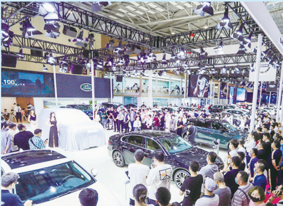
■2022第二十一届青岛国际车展成功举办。 资料照片