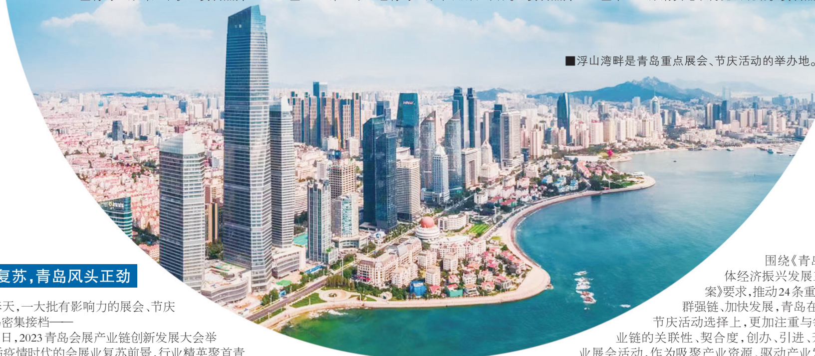
■浮山湾畔是青岛重点展会、节庆活动的举办地。