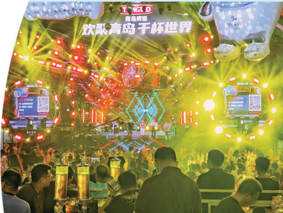
■青岛国际啤酒节。 资料照片