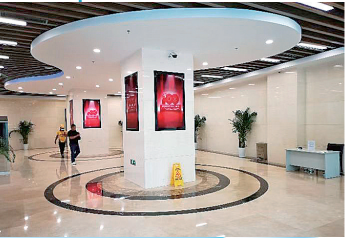
■ 更新改造后的市南区黄金广场。