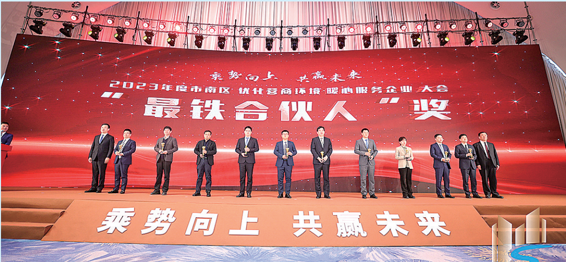
■ 市南区视企业为“最铁合伙人”。