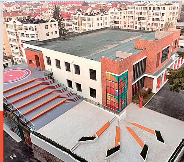
■ 华通中联产业园升级改造前后对比。