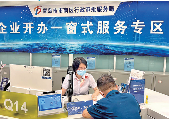
■ 市南区为企业注册提供“一窗式”服务。