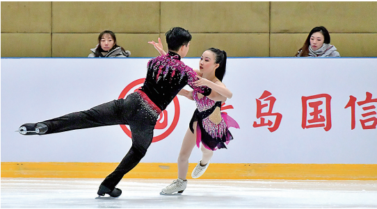
■2022—2023赛季全国花样滑冰冠军赛在青岛国信体育中心国信滑冰场精彩举办。

日前,2022—2023赛季全国花样滑冰冠军赛在国信滑冰场落幕。虽然比赛只有两天时间,但赛事引来的关注还是超乎所有人预料。本次比赛是国内花样滑冰项目最高水平、最高规格的比赛之一,也是本赛季的收官之战,共有来自全国各地的60名选手在男子单人滑、女子单人滑、双人滑、冰上舞蹈4个项目上展开角逐。赛事受到了冰迷的追捧,现场门票销售一空,20万观众通过网络观看比赛直播。