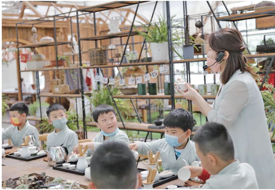
■东崂茶叶观光园内,小游客体验田园慢生活。

提供品牌流量效应。贯穿四季、丰富多彩的节会活动,正在成为城阳文旅的口碑之作和金字招牌。