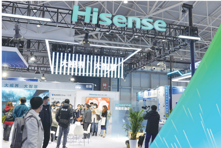
■科技文化旅游融合展馆的海信展区前人流涌动。

穿墙而过的巨龙、硕大的透明屏幕、可随时切换背景的虚拟演播场景……2023 青岛数字文化应用发展大会科技文化旅游融合展馆内,集中展示了中国先进科技企业的数字技术及其在文化、旅游领域的广泛应用。百余种融合产品让参观者意识到,科技正在无限拓展着文化产业的发展边界。