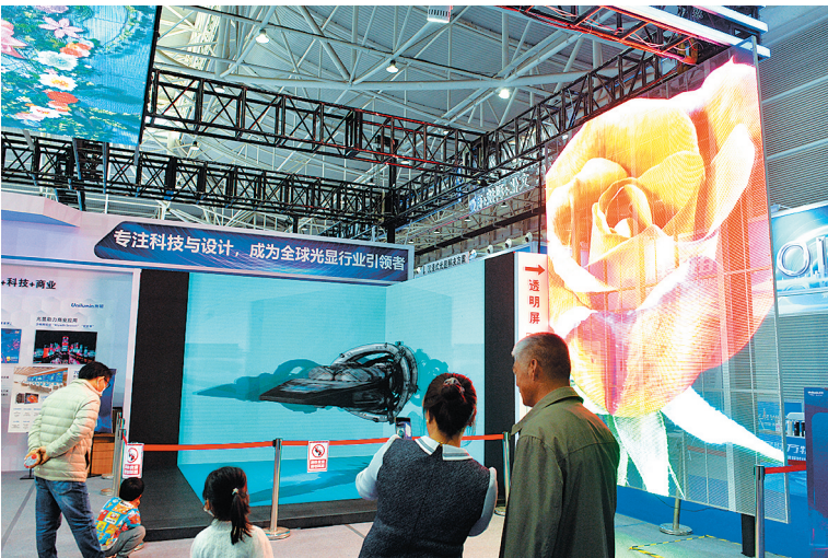
■洲明科技展示的透明屏与沉浸式光显大屏。