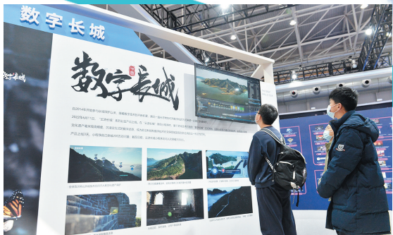
■腾讯的“数字长城”将文化遗产实现毫米级高精度还原。