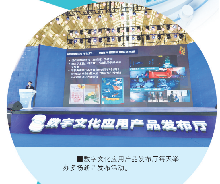
■数字文化应用产品发布厅每天举办多场新品发布活动。