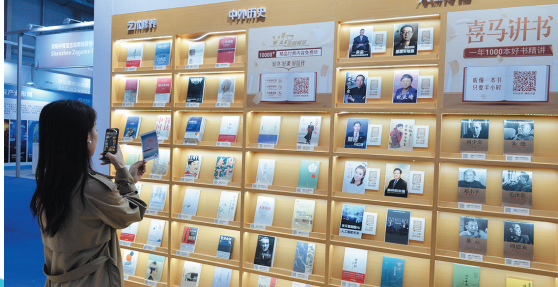
■喜马拉雅的喜马拉雅讲书让文字书籍即刻“发声”。